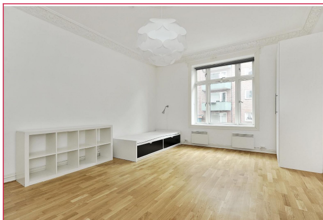
Eksempelbilde hybel (fra en annen hybel)