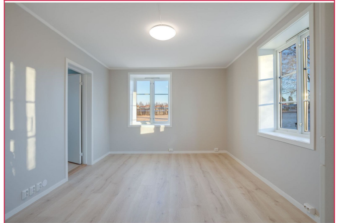
Fra stue er det adgang til soverom og bad.