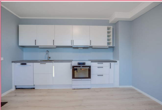
Moderne kjøkken med frittstående hvitevarer.