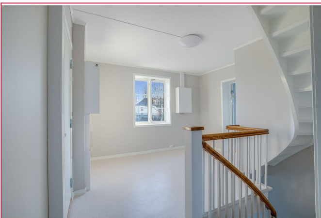
Felles gang med adgang til alle leiligheten.