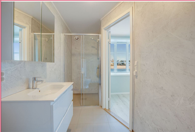
Lekker bad med dusjhjørne og opplegg for vaskemaskin.