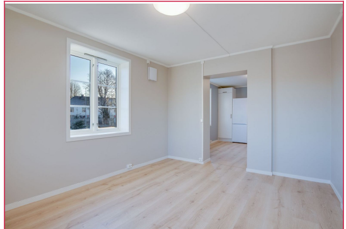
Åpen stue med adgang til kjøkken.