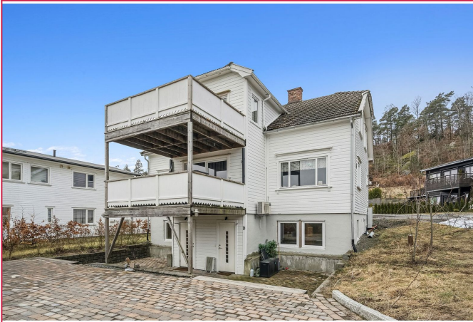
Strøken 2-roms leilighet i Stavern. Leiligheten ligger til høyre i 1. etg.