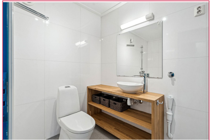
Delikat, flislagt badepom med toalett, servant m/innredning, dusjsone og vaskemaskin.