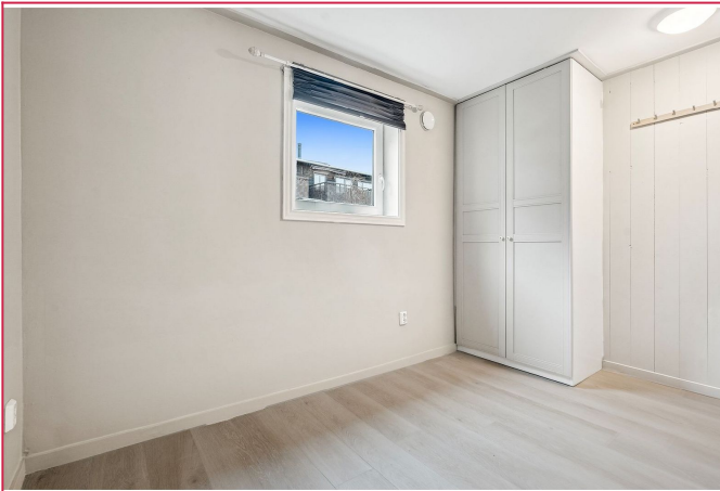
Trivelig soverom med garderobeskap.