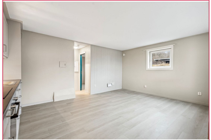
Pent kjøkken med integrert oppvaskmaskin, komfyr og steketopp.