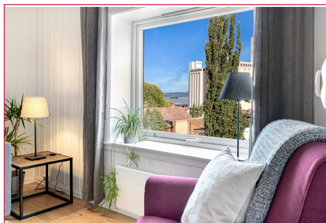
Utsikt mot fjorden.