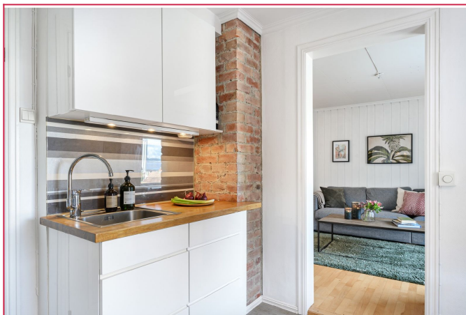
Kjøkkenet kommer med komfyr og platetopp, samt en mindre oppvaskmaskin.