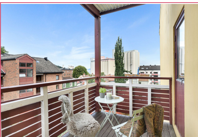
Balkong med utsikt vendt mot fjorden.