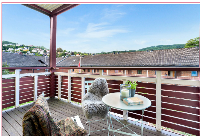
Balkongen er av god størrelse og har plass til stoler og bord.