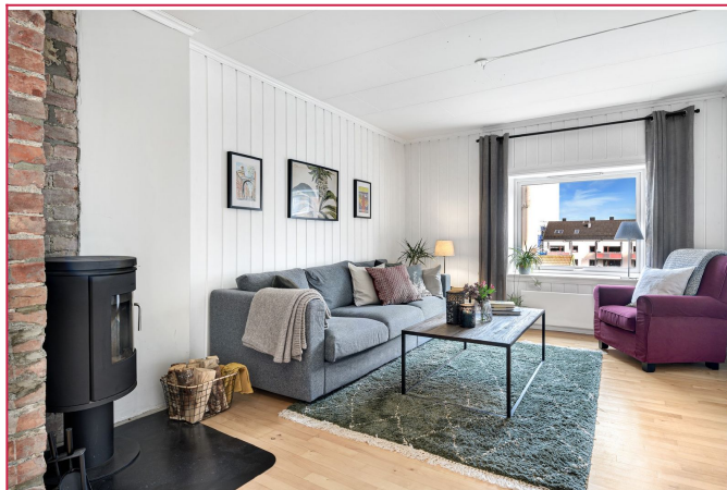
Leiligheten er delvis møblert.