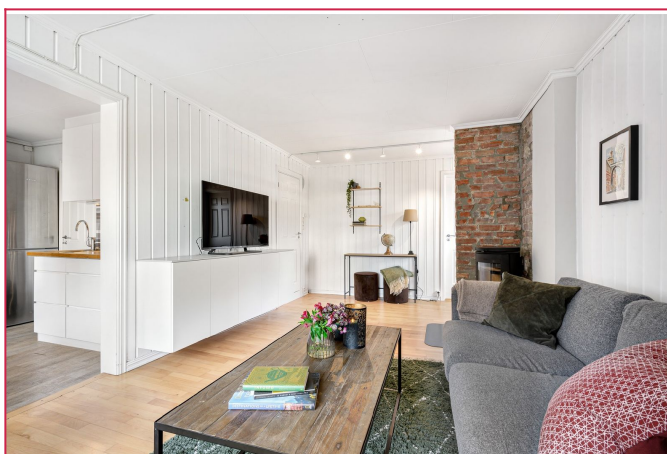
I stuen har man vedfyring som gir en lun atmosfære.