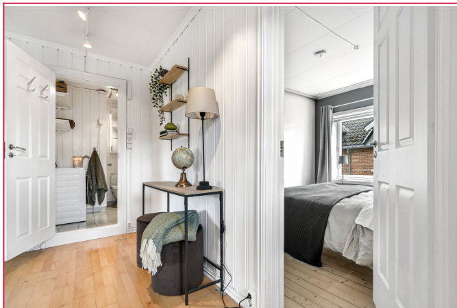
Her får du internett og TV inkludert, samt bod i kjelleren.