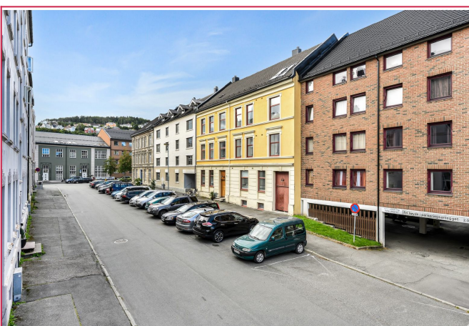
Fasade mot gaten. Inngangen finnes gjennom tunnelen og bak i bakgården.