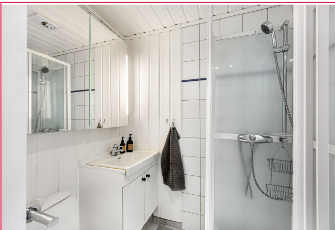
Badet er flislagt og har dusjkabinett.