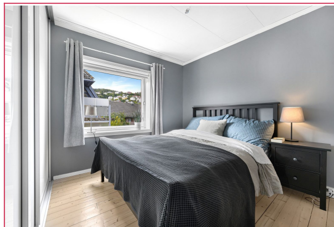
Soverom med god lagringsplass i skyvedørgarderoben.