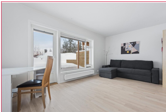
Stue med utgang til stor terrasse