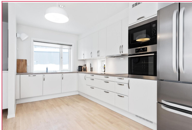
Pent kjøkken med nye hvitevarer