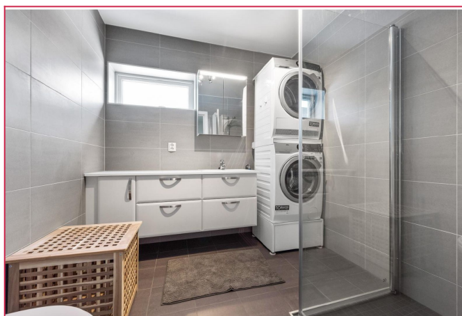
2. etg: Flislagt bad med varmekabler. Vaskemaskin og tørketrommel følger med.