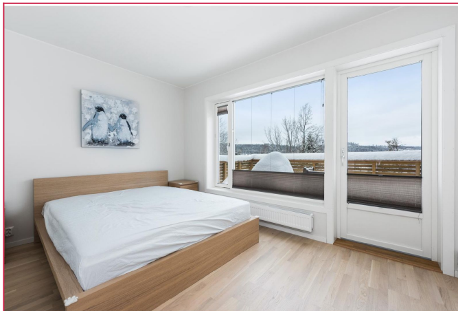
2. etg: Hovedsoverom med utgang til balkong