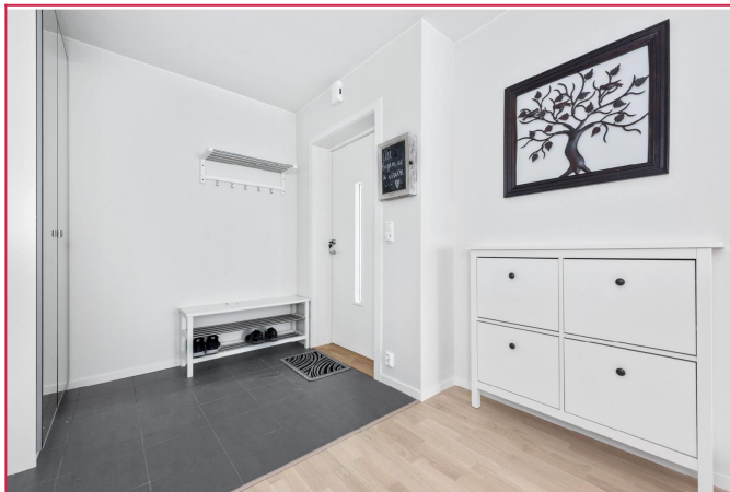
Entré med garderobeskap