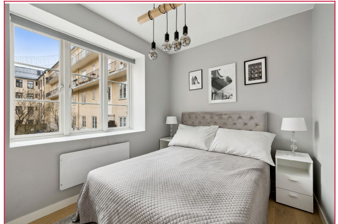
Hovedsoverom med skyvedørgarderobe og vindu vendt mot bakgård