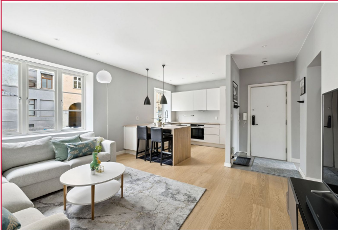
Lekker stue med åpen kjøkkenløsning