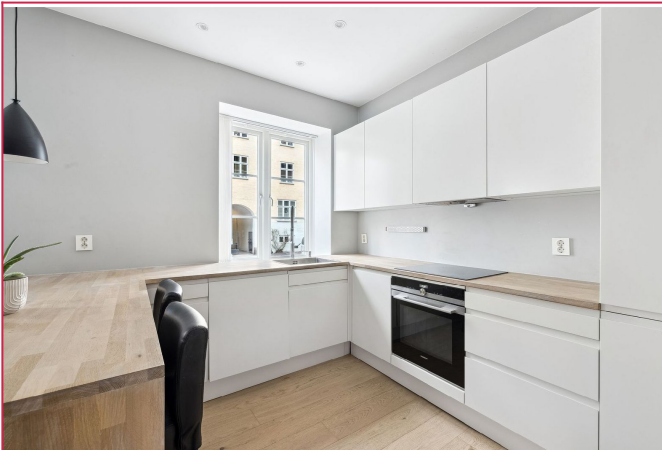
Praktisk kjøkken med integrerte hvitevarer