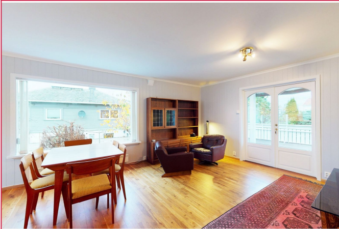
Stue med utgang til terrasse.