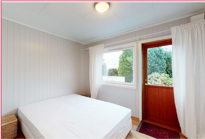
Soverom 1 med utgang til terrasse.