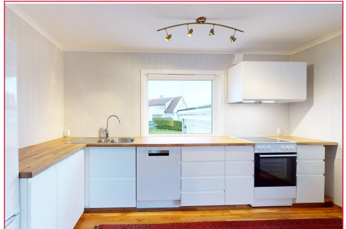
Kjøkken med hvitevarer.