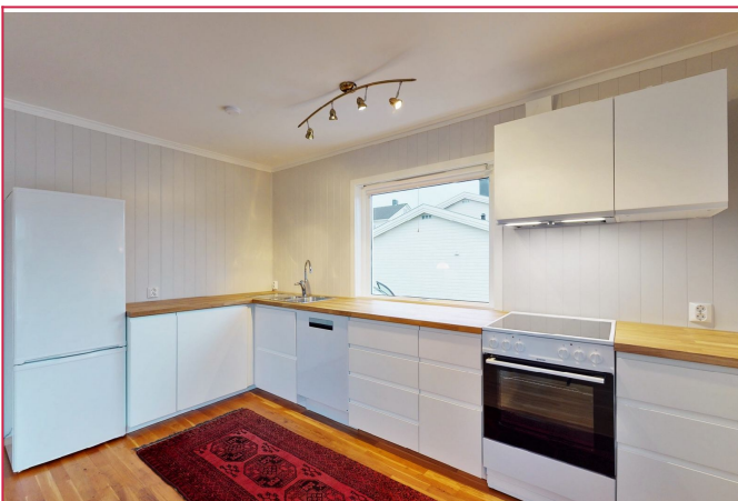
Oppusset i 2020.