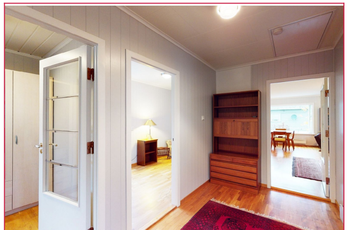
Fra gang er det tilkomst til 2 soverom, baderom, vindfang og stue/kjøkken.