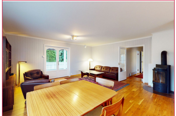
Stue med peisovn.