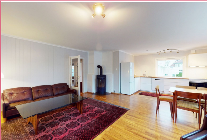
Åpen stue- og kjøkkenløsning.