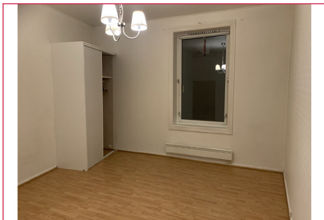
Lys stue som vender mot bakgården.