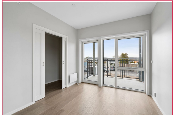
Hovedsoverom med walk-in closet