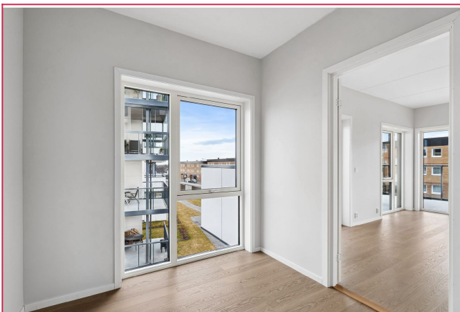
Soverom nr. 2