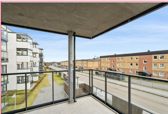
Leiligheten har en romslig balkong