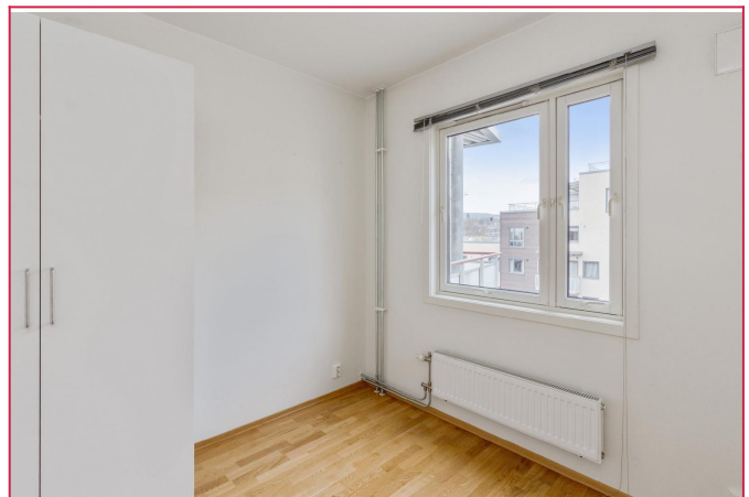
Det minste soverommet har plass til 1,20 m seng