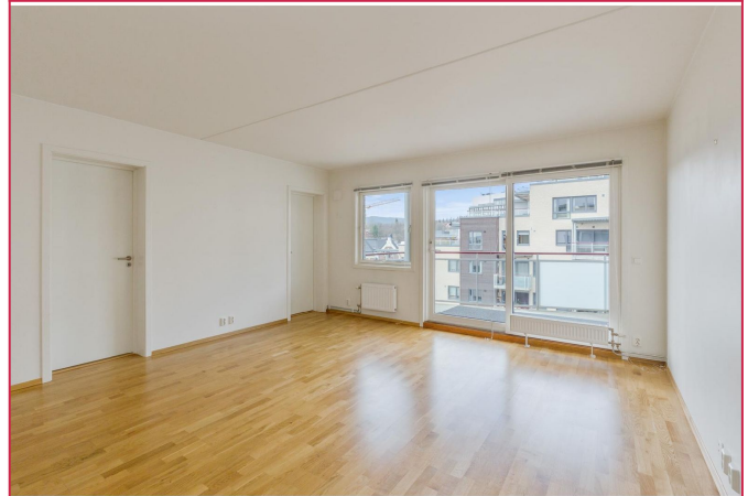
Åpen og lys stue som er enkel å innrede etter ønske