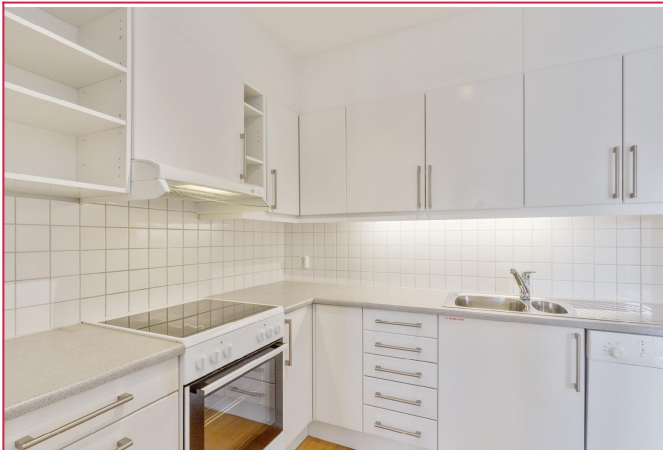
Lyst kjøkken med mye skaplass