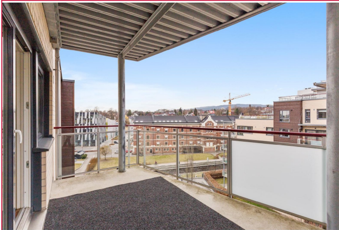
Stor og solrik balkong som vender mot nordvest med utsikt mot Akerselva