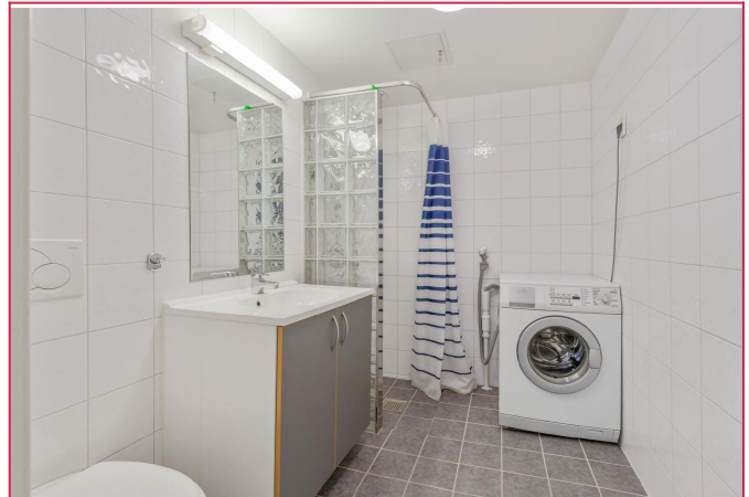
Pent, flislagt bad med varme i gulv