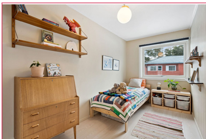
Soverom nr. 2, perfekt som barnerom, gjesterom eller kontor.