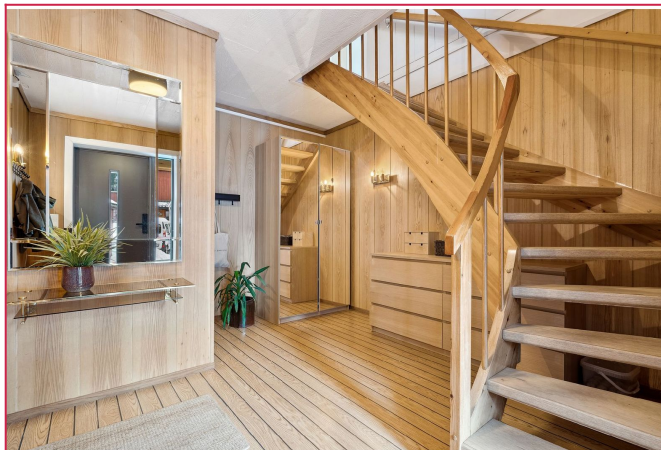
Pen entre med garderobereskap.