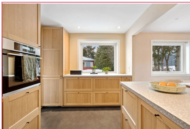
Pent og moderne kjøkken med hvitevarer.