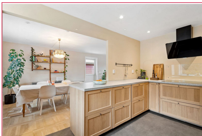
Kjøkkenet ligger åpent mot spisestue, noe som skaper en hyggelig og sosial sone.