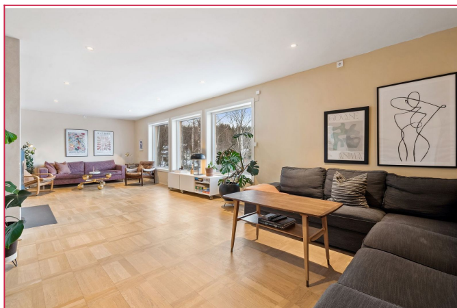
Dette er en fin og luftig enebolig.

SAKSNUMMER 56941 - GRUVELIA 1 C, 0957 OSLO