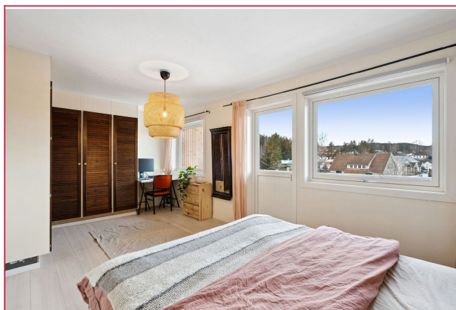
Hovedsoverom med utgang til balkong og garderobeskap.