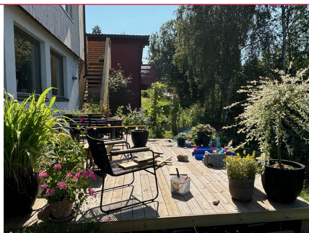
Privat bilde- pen terrasse med plass til utemøblement.