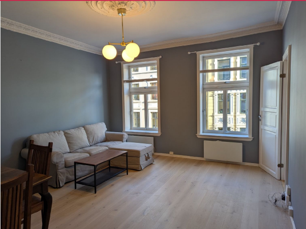
Nydelig stue med gode lysforhold. Sofa, stuebord og spisebord kan medfølge.