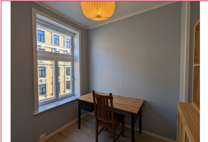
Soverom nr. 2 med skrivebord og bokhylle.