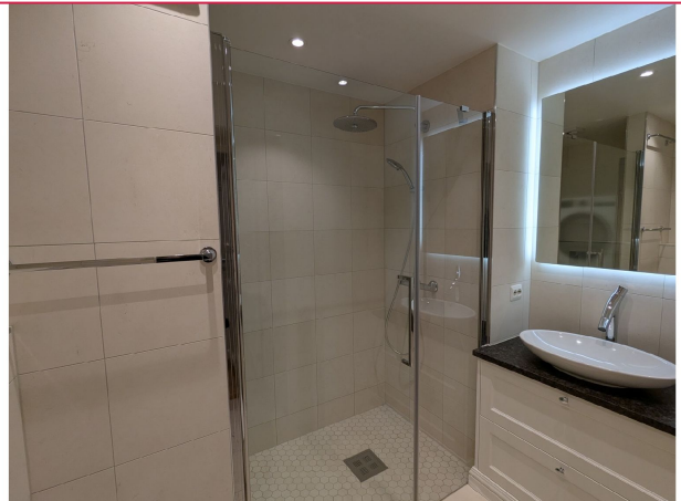
Flislagt bad med varmekabler, og innredning av god kvalitet.