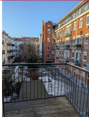
Utsikt fra balkongen. Boligen er ledig omgående til langtidsleie.