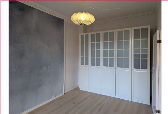
2 garderober med medfølger, med god oppbevaring.