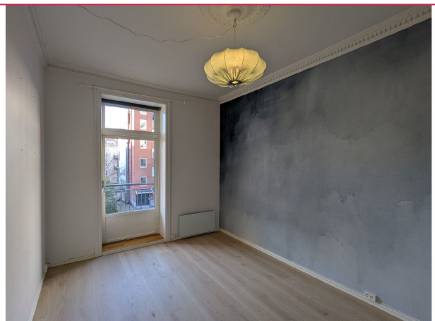
Hovedsoverom med utgang til en romslig balkong og plass til en dobbeltseng.