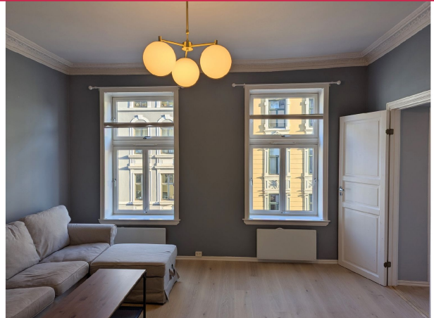
Fine, klassiske detaljer som rosett og stukkatur i tak. Boligen er ledig fra 1.2 til langtidsleie.