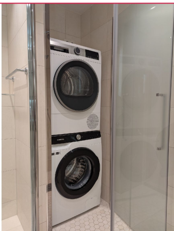
Nyere vaskemaskin og tørketrommel medfølger også.