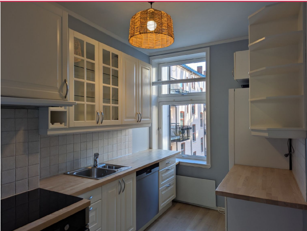
Flott kjøkken med alle hvitevarer inkludert. Rikelig med benke- og skaplass.