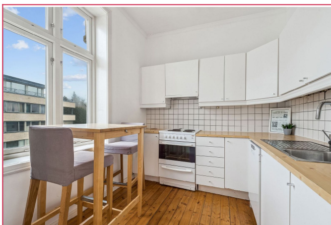
Spiseplass på kjøkken.