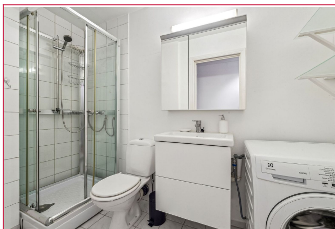
Baderom med dusjkabinett og vaskemaskin.