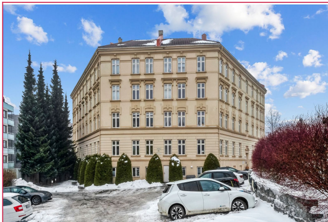
Leiligheten ligger i et veletablert boligområde på Skøyen.