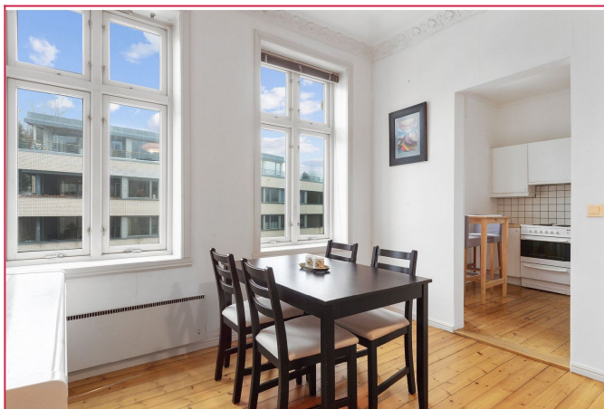
Varmtvann er inkludert i husleien.