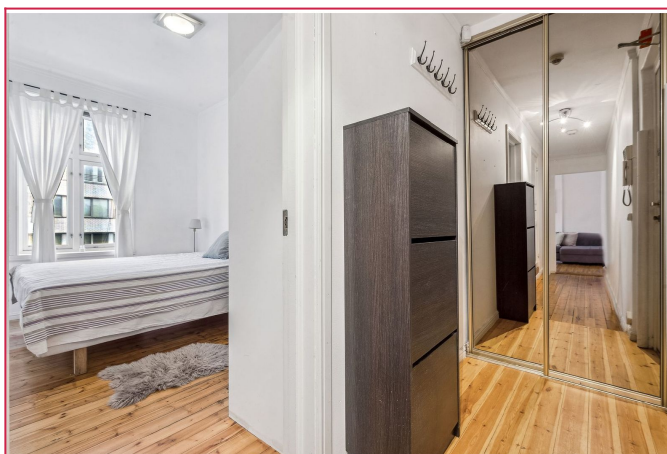
Ekstra oppbevaring i entré.