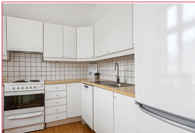
Separat kjøkken med hvidevarer.