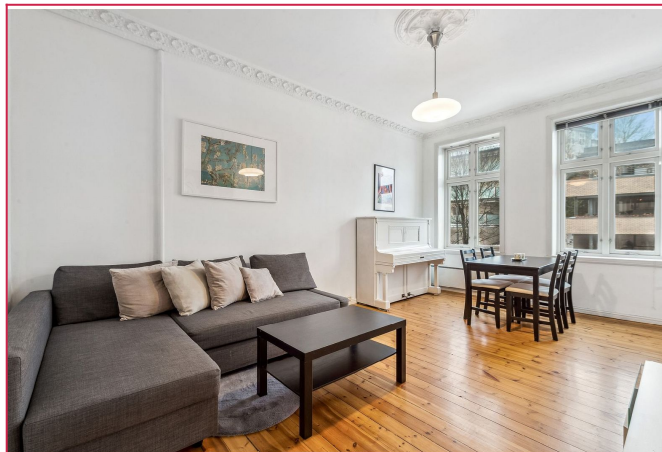
Romslig stue med flere møbleringsmuligheter.