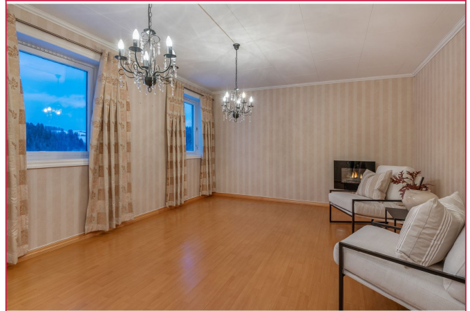
Lys og pen stue med store vindusflater som gir godt med lysinnslipp