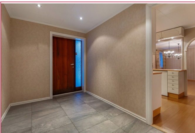
Leiligheten har en romslig entrè med god plass til oppbevaring av yttertøy