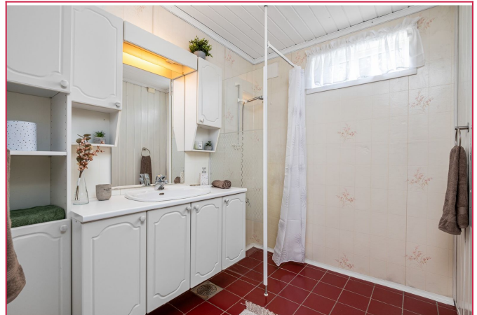
Sjarmerende badrom med god plass til lagring av toalettsaker og andre badartikler