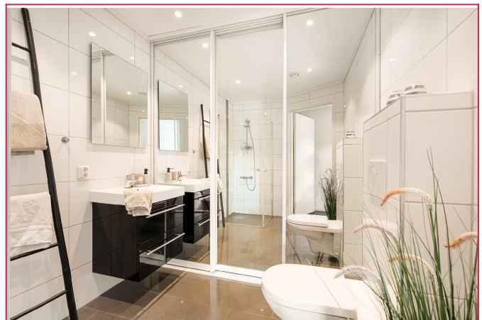
Fint bad/vaskerom. Vaskemaskin og tørketrommel plasseres bak garderobeskap.