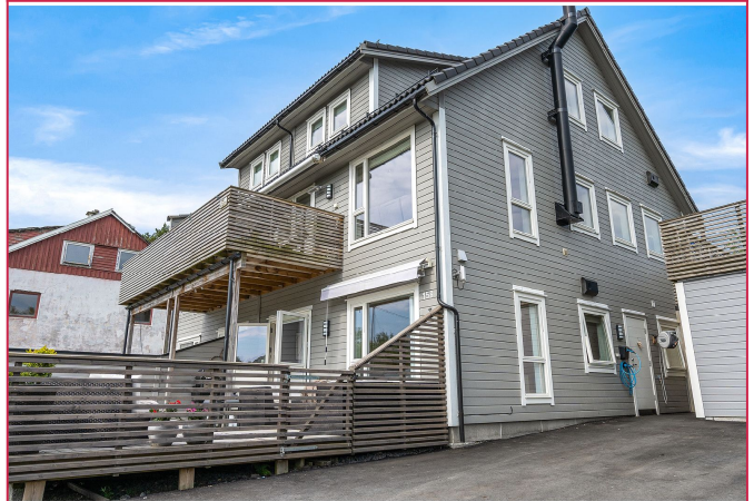
Velkommen til Marikovvegen 15B!