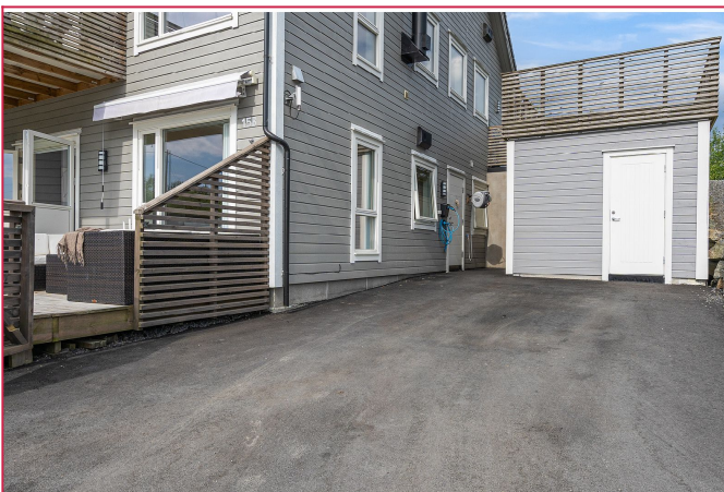
Stor parkeringsplass med el-bil lader.