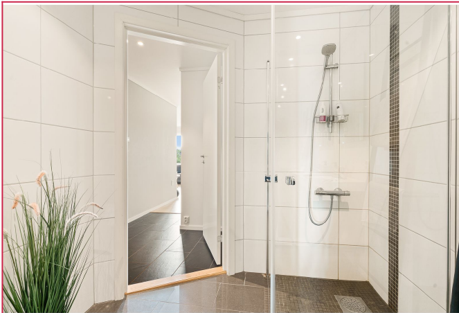
Bad med servant, dusj og toalett. Varmekabler i gulv.