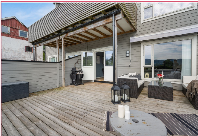
Leiligheten har stor terrasse med god plass. Her kan en nyte fine sommerdager.