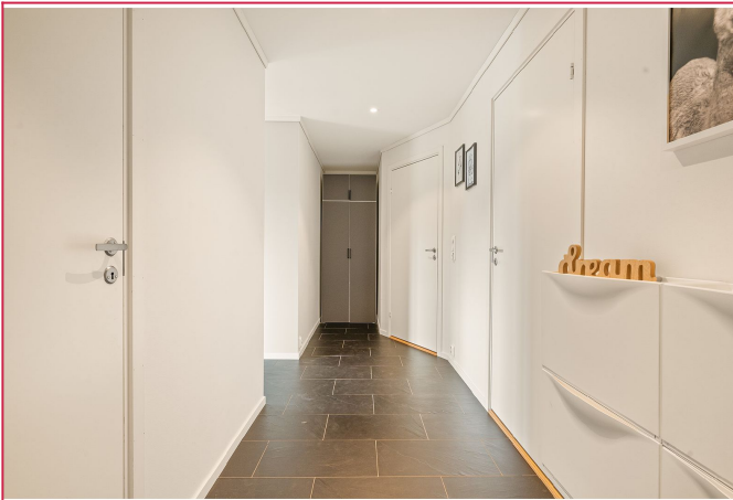
Leiligheten har en romslig gang med varmekabler i gulv. Her er det flislagt gulv og slette vegger.