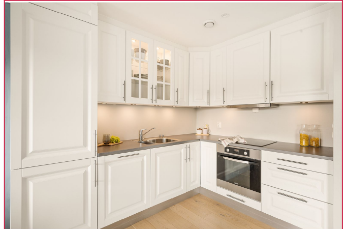
Fint kjøkken med integrerte hvitevarer som komfyr, platetopp, kjøleskap, frysenskap og oppvaskmaskin.