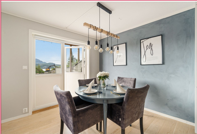
Stue med vinduer som slipper inn rikelig med naturlig lys.