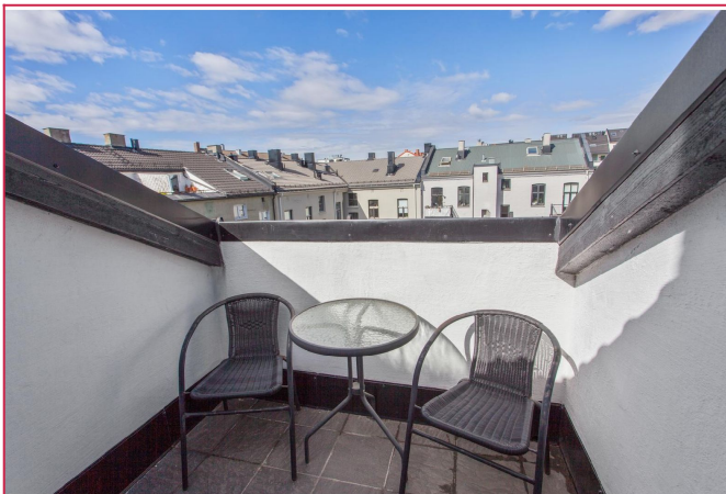
Solrik og privat takterrasse.