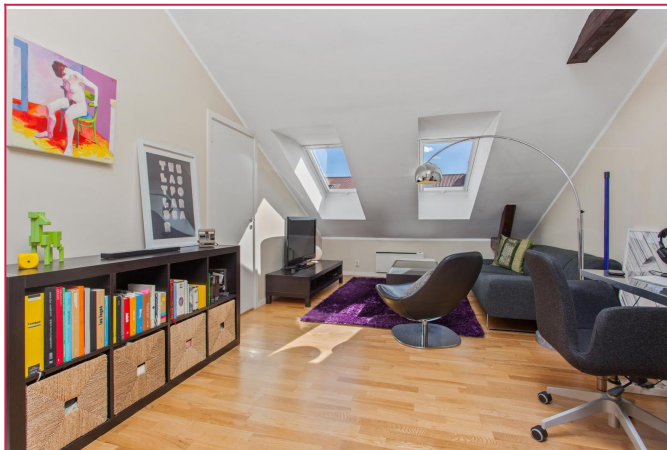
Stue med godt lysinnslipp.