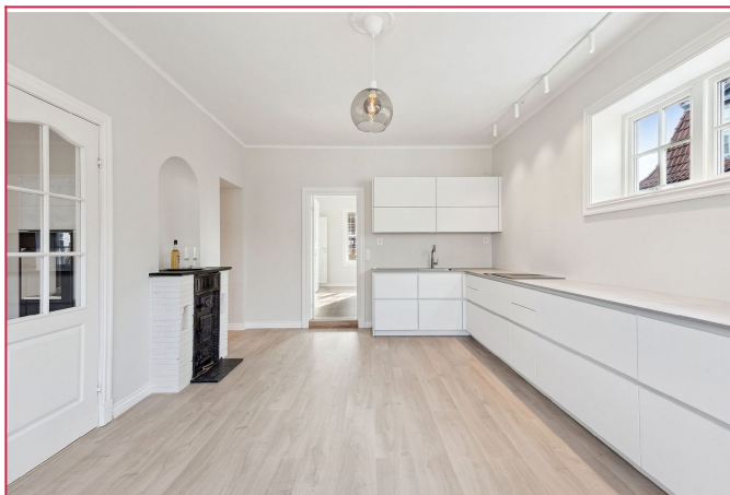
Leiligheten ligger meget sentralt på Frogner.