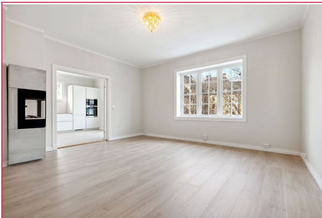
Velkommen til Thomas Heftyes gate 2!