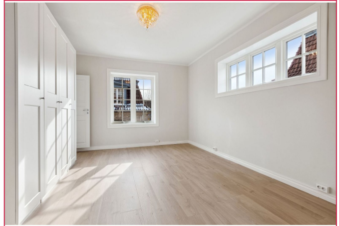
Romslig soverom med garderobeskap.