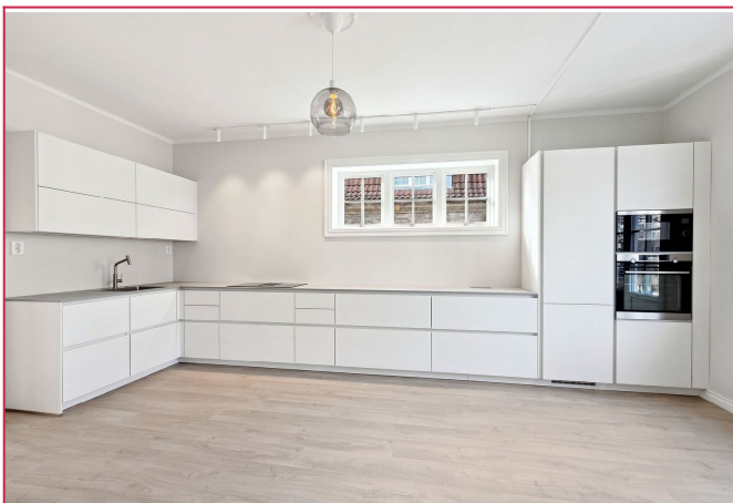
Lekker kjøkken med god benplass.