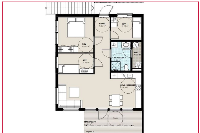
Plantegning* ikke målbar