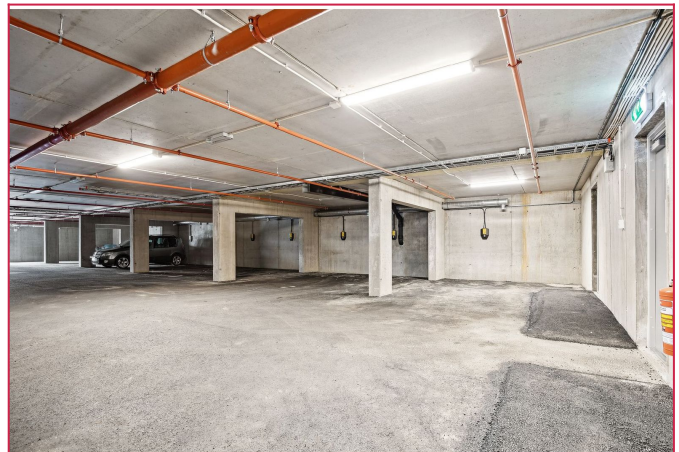
Det medfølger garasje plass med opplegg for lader