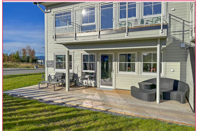
Terrassen er utvidet og har gode solforhold