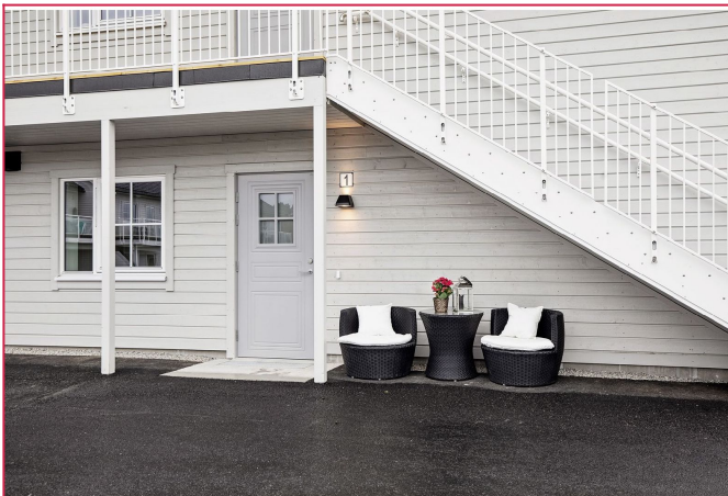
Inngang på bakkeplan med plass til cafésett