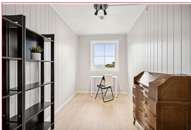
Boligens tre soverom har plass til dobbeltseng