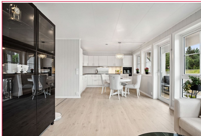
Stue og kjøkken i åpen løsning. God plass til spisebord på kjøkken