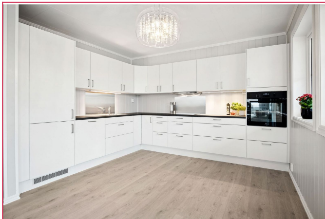
Stort og lekkert kjøkken med integrerte hvitevarer