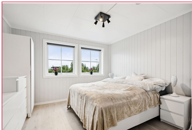
Boligens hovedsoverom med skap og to kommoder som medfølger