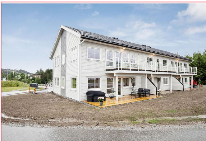
Velkommen til Trolldalen 1!