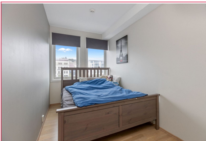
Soverom 1 med plass til dobbeltseng