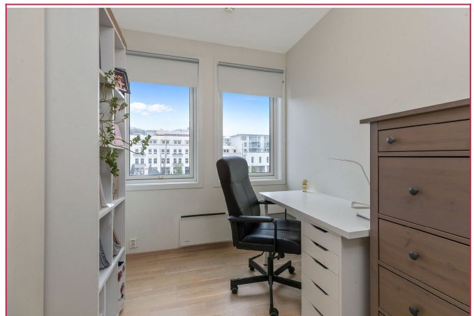
Soverom 2 kan benyttes som kontor