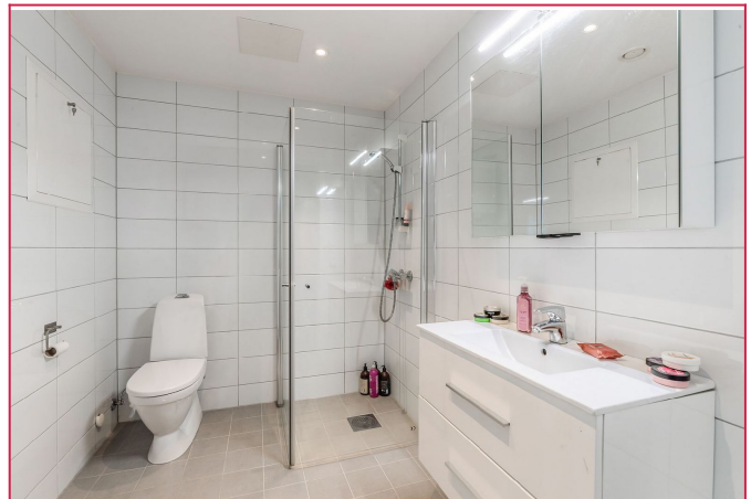
Pent flislagt bad med hjørnedusj, WC og servant m/ innredning