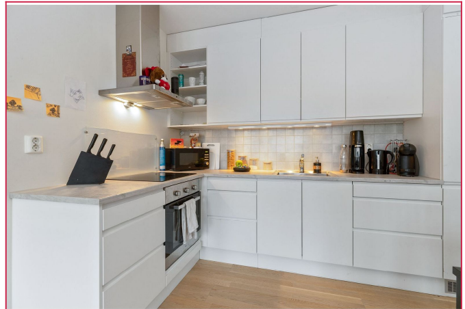
Kjøkkenet i hvite fronter med integrerte hvitevarer