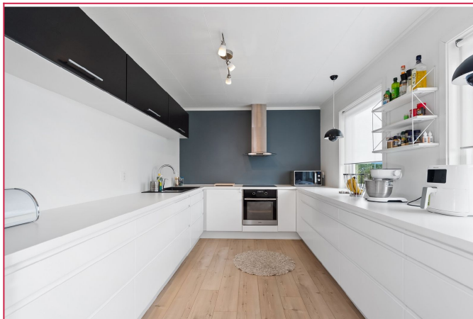
Lekker kjøkken med integrerte hvitevarer