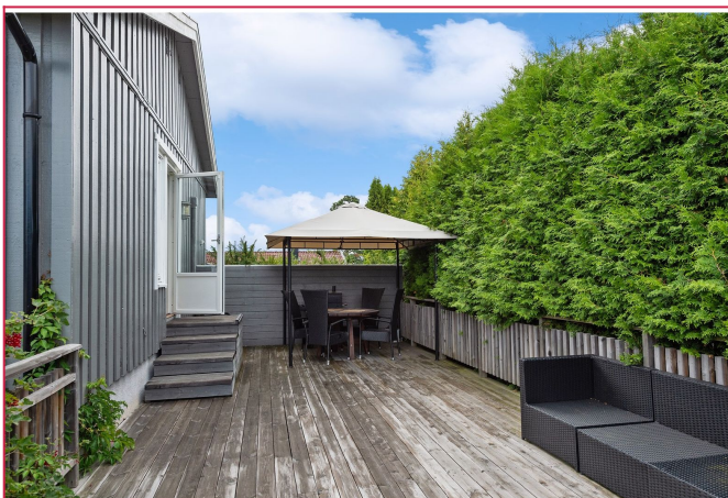
Nydelig terrasse med utgang fra stue