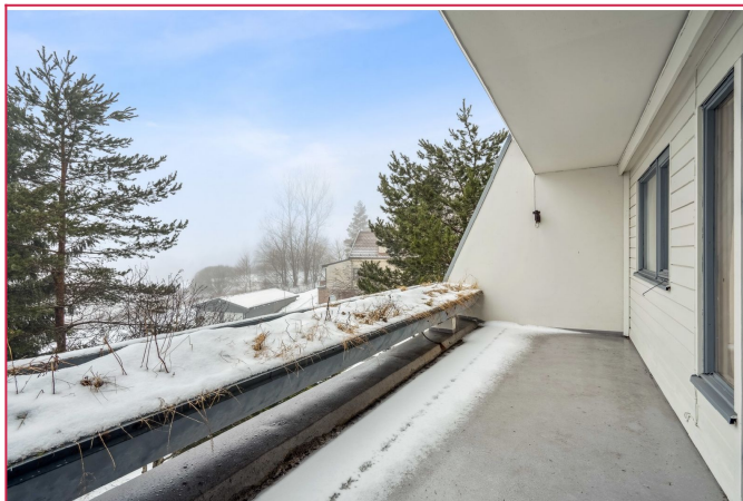
En av leilighetenens to balkonger.