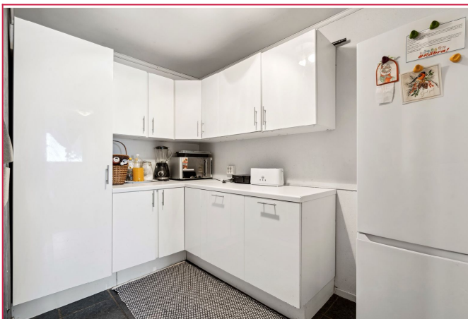
Leiligheten har to kjøkken.