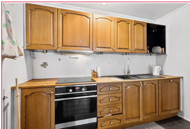
Oppvaskmaskin og komfyr medfølger.