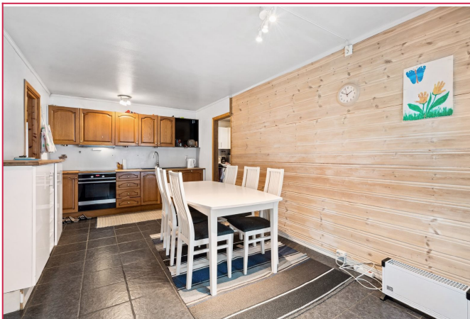
Stort kjøkken med plass til kjøkkenbord.