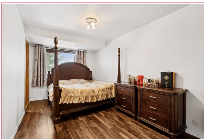
Stort soverom med plass til dobbeltseng.