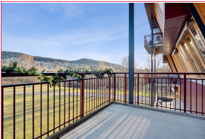
Balkong - Utsikt over flotte grønne omgivelser og Akerselva.