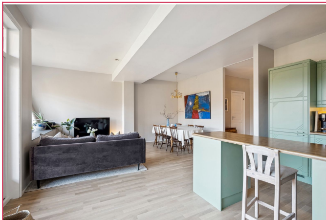
Stue - god plass til sofa og spisebord.