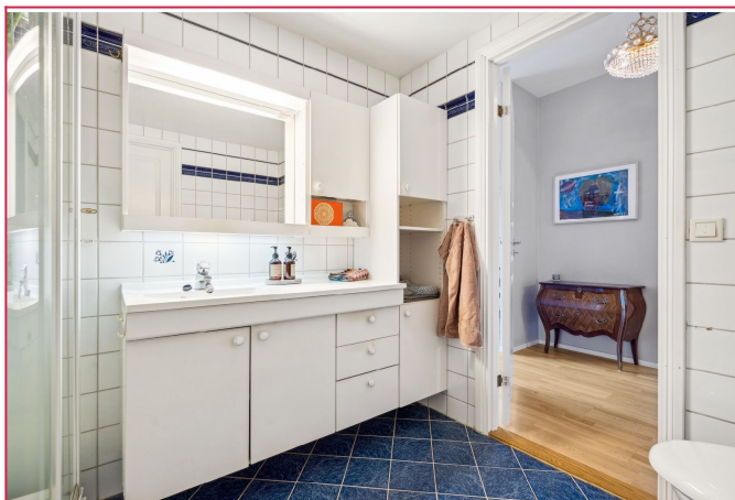
Baderom - Flisbelagt guly med varmekabler