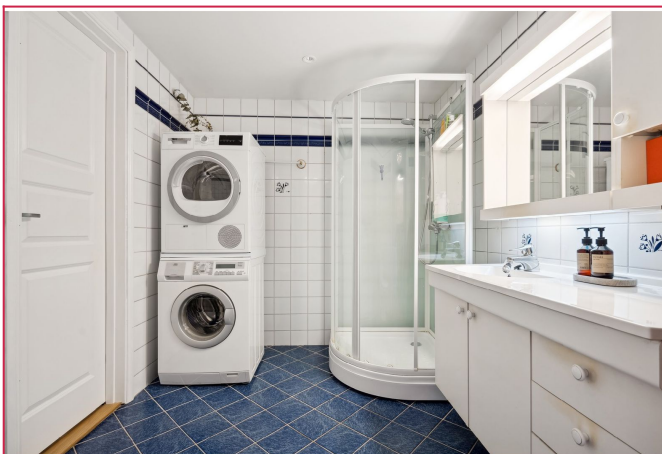
Baderom - Vaskemaskin og tørketrommel følger med. Eget dusjkabinett