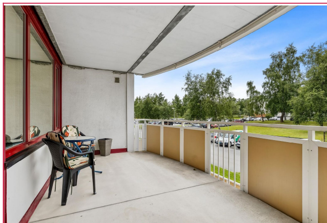
Stor balkong med god plass til utemøbler