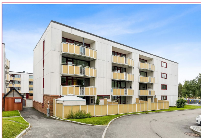
Fasade - Leiligheten ligger i byggets 1.etasje