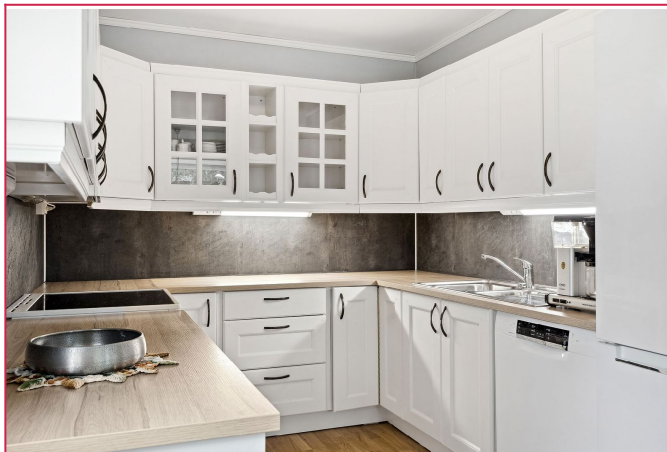
Lyst og pent kjøkken med mye skap-og benk plass