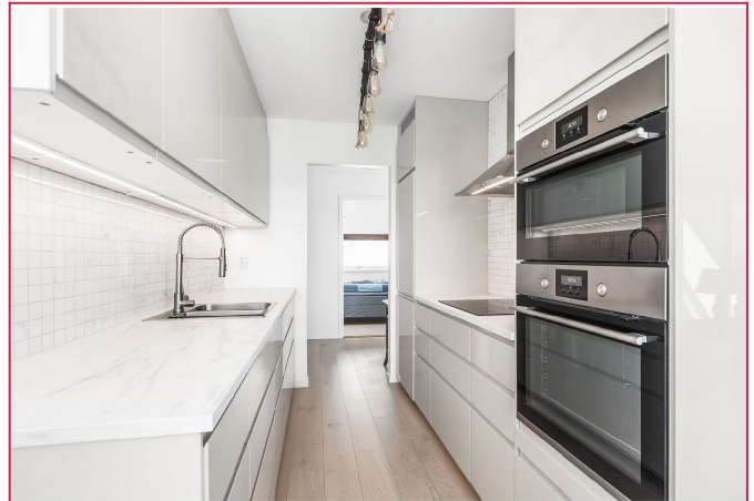
Lyst og fint kjøkken med integrerte hvitevarer.