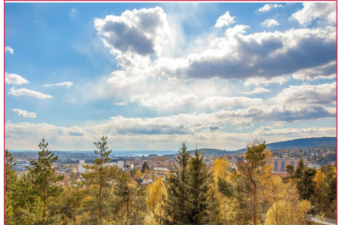
Utsikt over Oslo