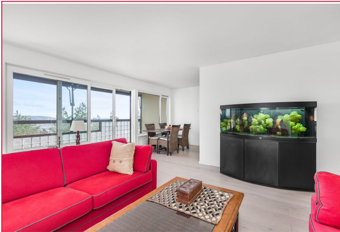
Stue med direkte utgang til balkong