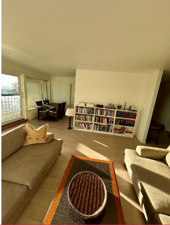
Stuen i dag