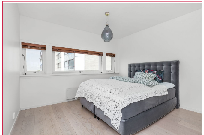
Soverom 1 av 2 i boligen, begge er av god størrelse.