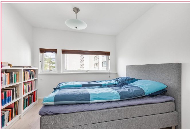
Soverom 2, god plass til dobbeltseng.