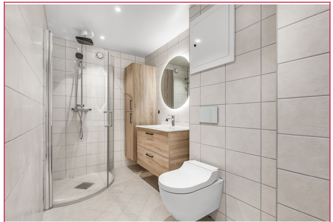
Pent flistlag bad