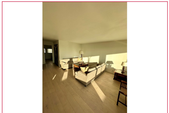
Stuen i dag