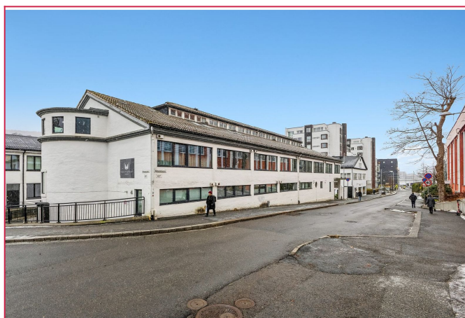
Fasade - Her finner du Bunnpris og Joker i umiddelbar nærhet. Muligheter for leie av parkering.