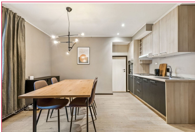
Kjøkkenet har sin egen avdeling med det man trenger av hvitevarer, her har du spisebord og 4 stoler.