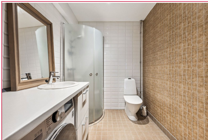
Moderne bad med fliser, her følger kombinert vask/ tørk- maskin med