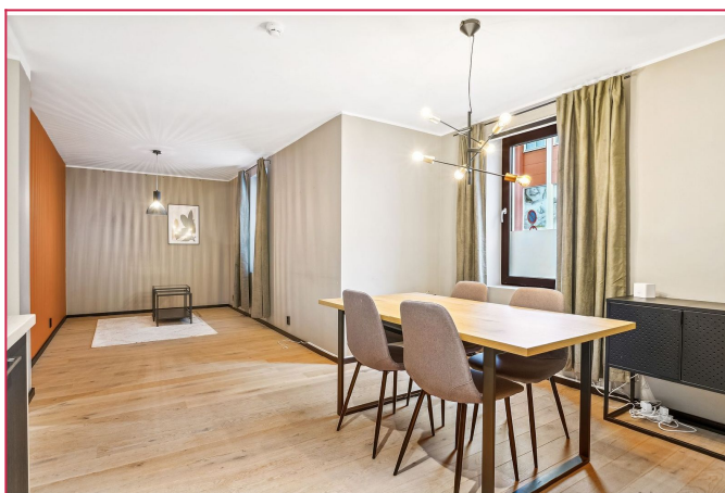
Stuen er møblert, her mangler du bare sofaen!