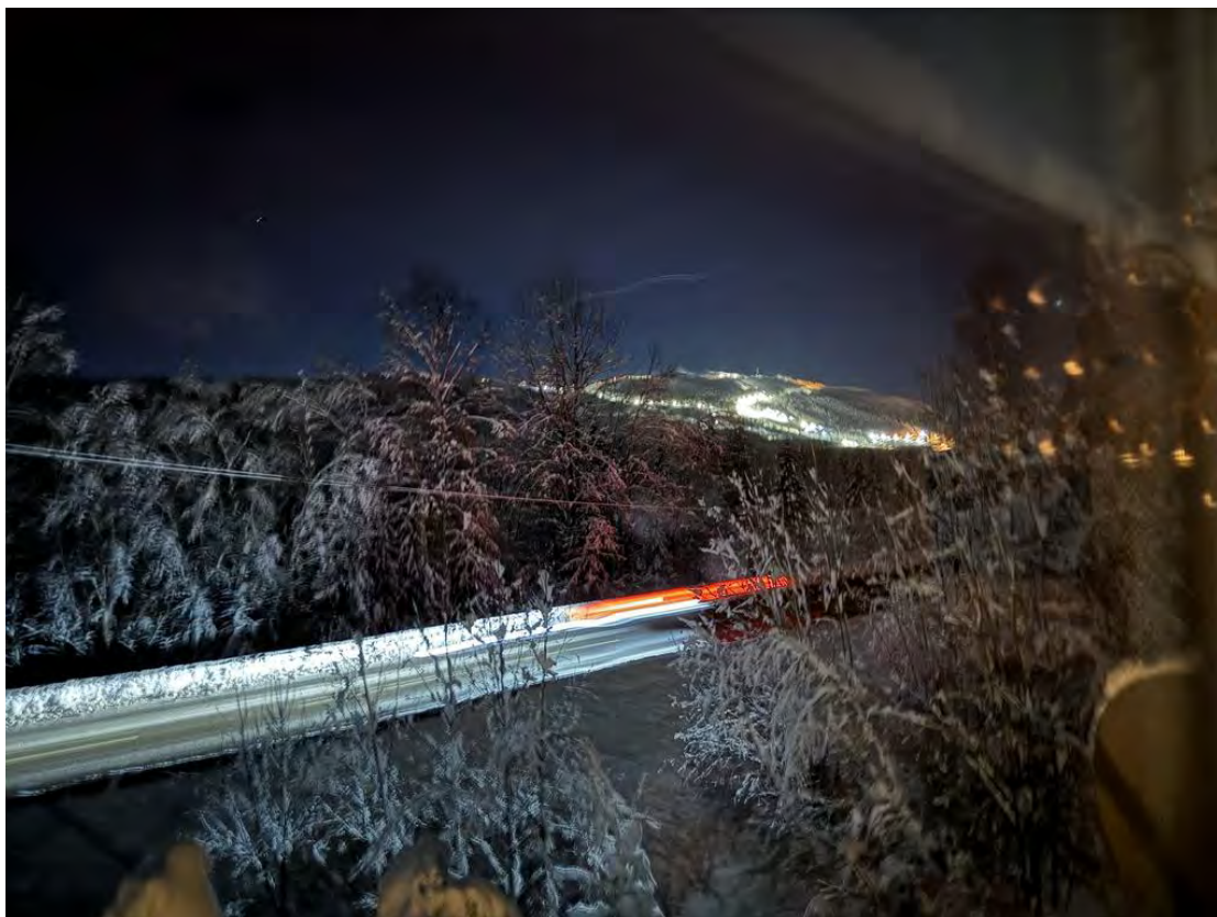
Branäs skidanläggning taget från sovrummet