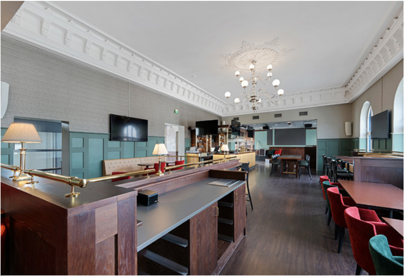
Restaurant 2. etg.