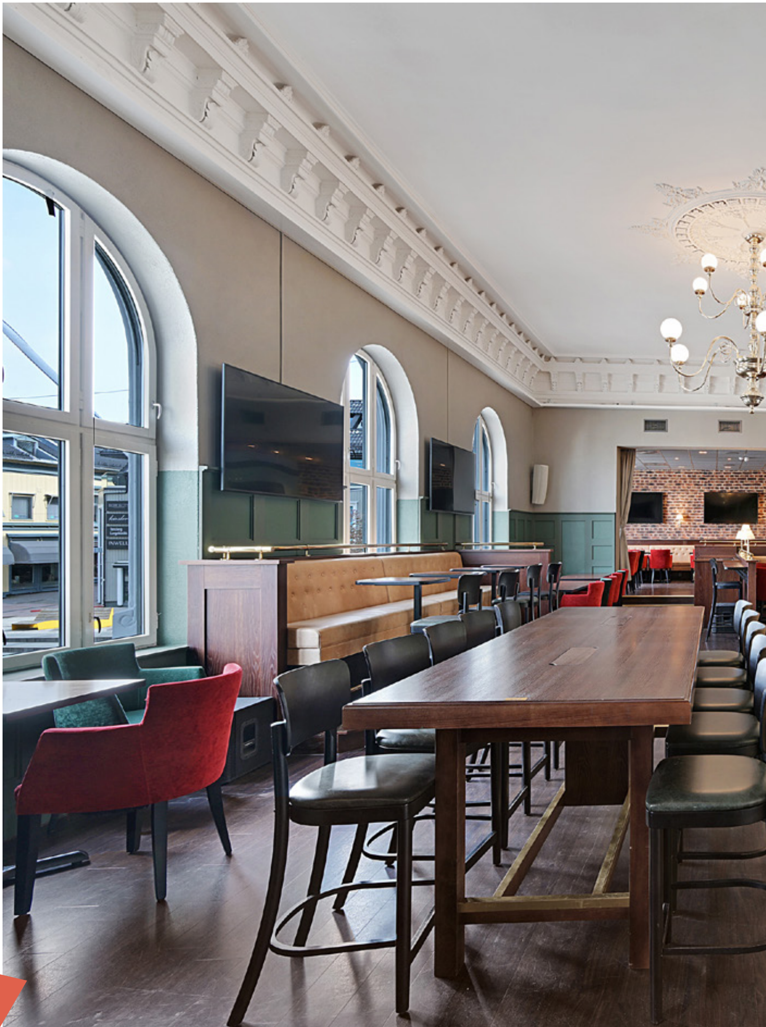
Restaurant/bar 2. etg.