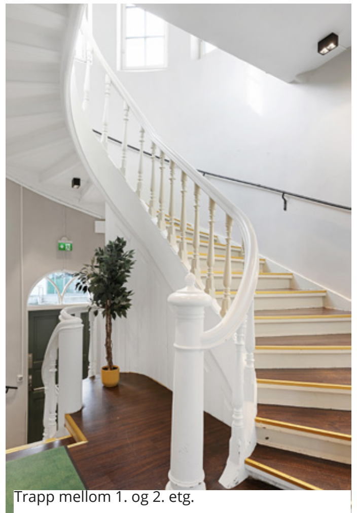
Trapp mellom 1. og 2. etg.