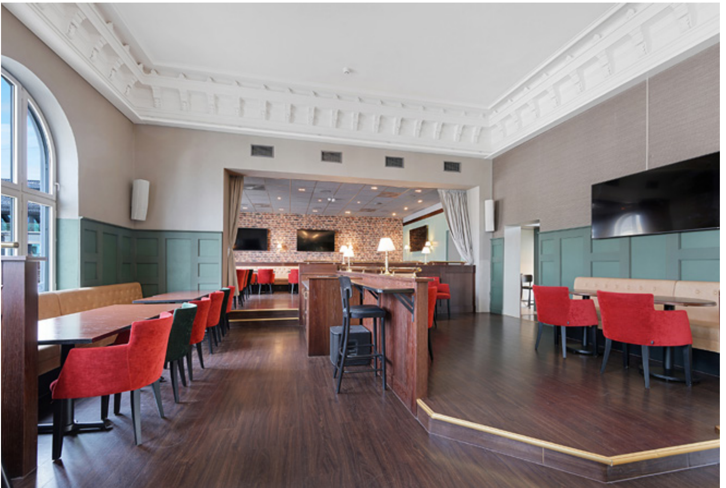
Restaurant 2. etg.