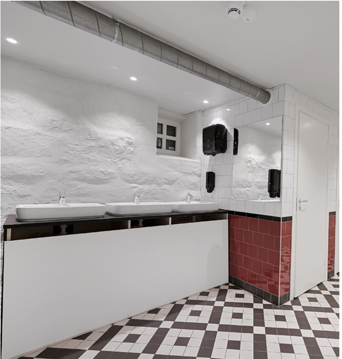
Toalettanlegg u. etg.