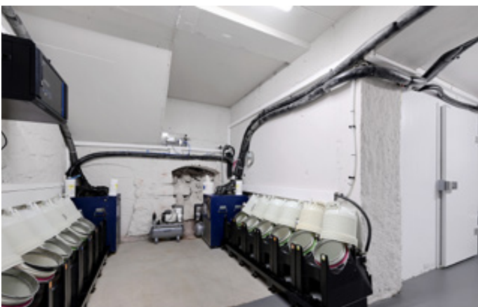
Lager for øl