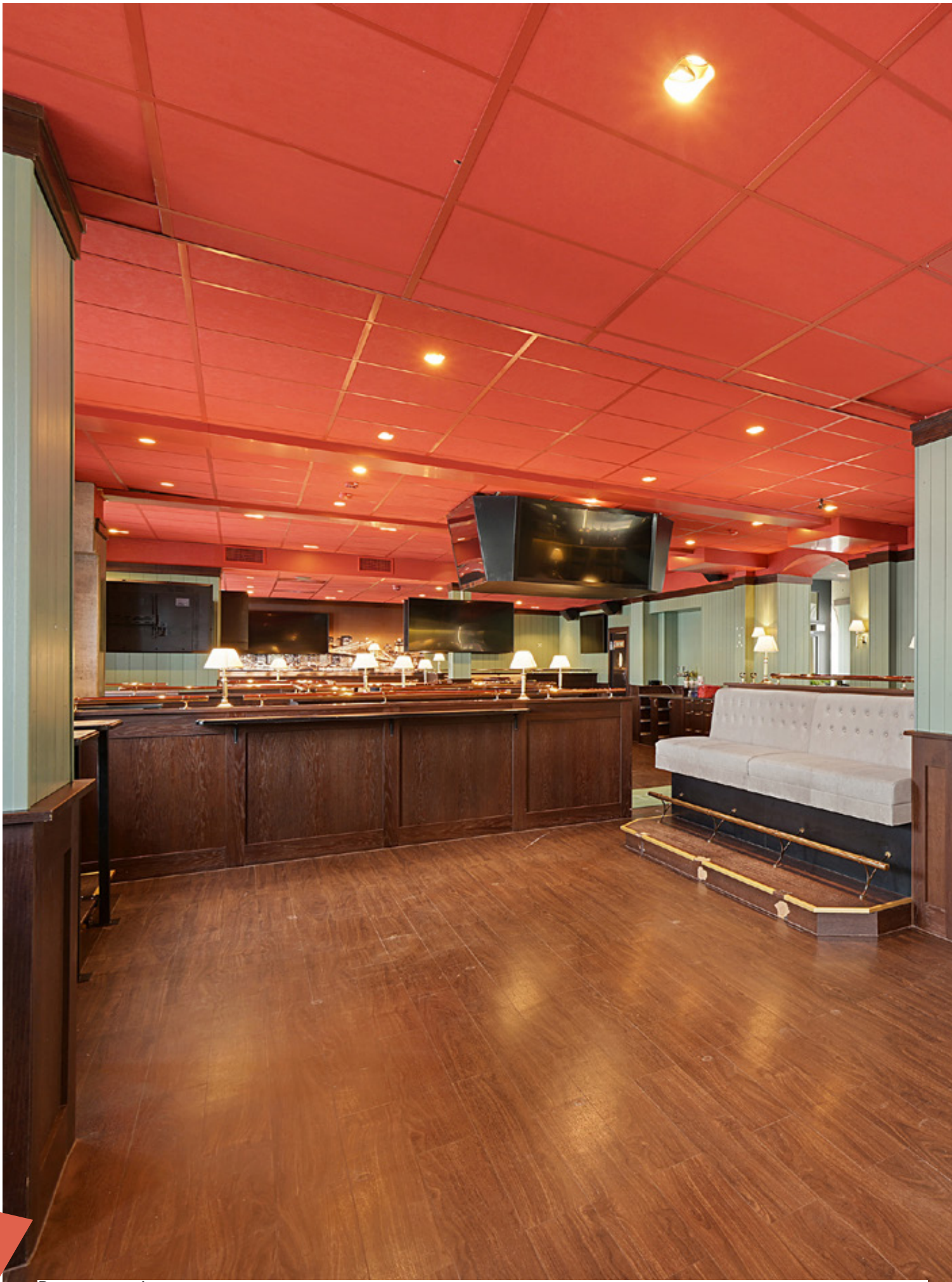
Restaurant 1. etg.