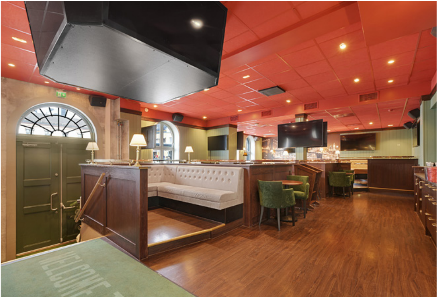
Inngang/restaurant 1. etg.