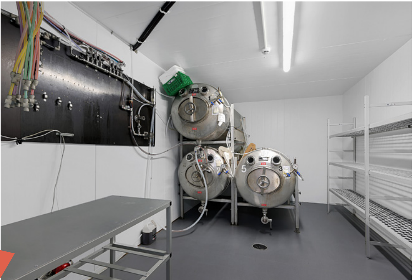
Lager for øl