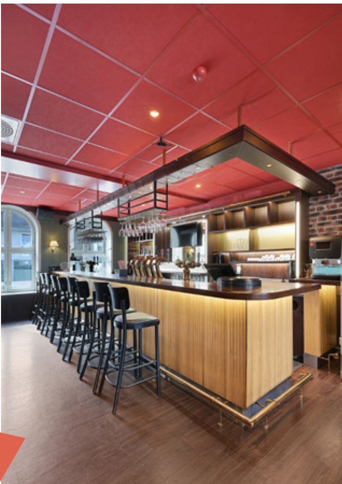
Bar 1. etg.