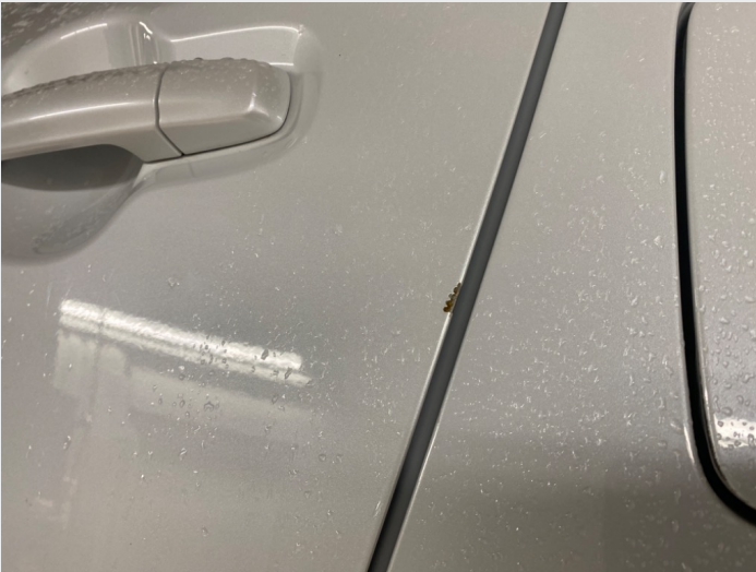
2.5 Chippet av lakk venstre bakdør, rust påbegynt