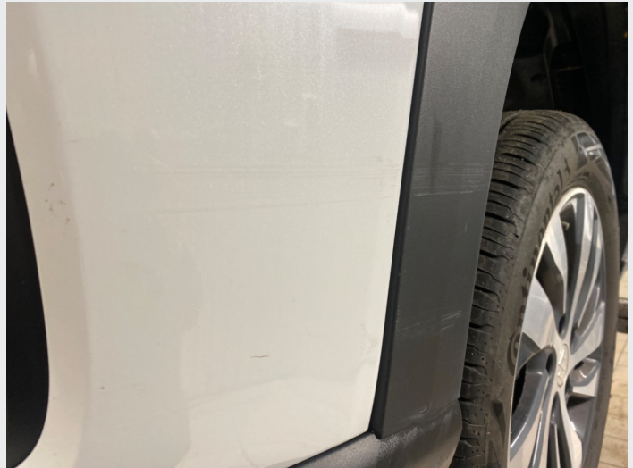
2.8 Noe striper venstre foran, hjulbuelist og fanger