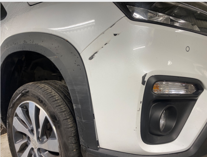
2.8 Skade høyre foran, løstet hjulbuelist samt mye striper og lakkskader