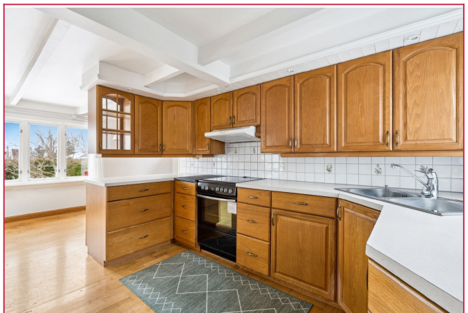
Kjøkkenet er et klassisk eikekjøkken med mye skap- og benkeplass. Hvitevarer medfølger.