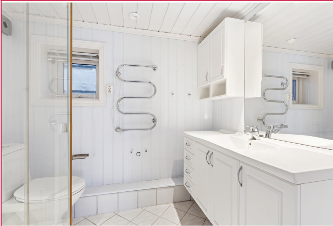
Badet er som resten av huset i klassisk stil med malt panel på vegger og tak.