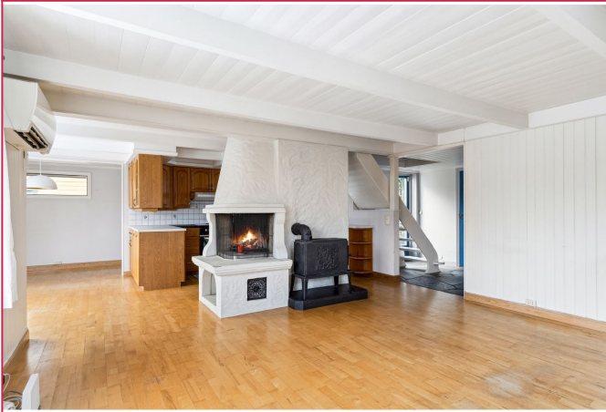
Romslig stue med åpen peis for kosen og vedovn for varme. God plass til stor sofagruppe.