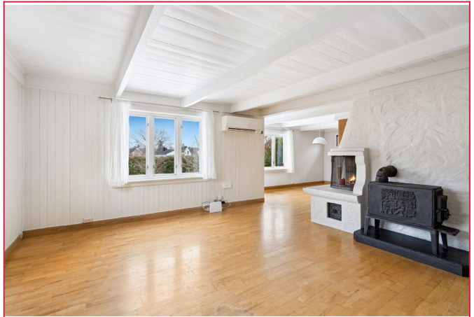
Åpent og lyst. Mange vindusflater gir en god romførelse. Varmepumpe er praktisk i eldre hus.