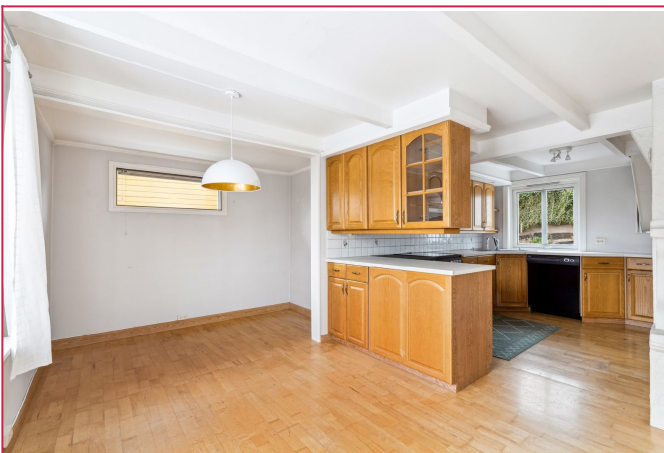
Delvis åpen løsning mellom kjøkken og spisestue. Kjøkken-halvøy med skap og overskap på begge sider