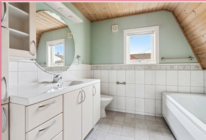
Pent og praktisk bad i 2.etasje med badekar og moderne innredning. Godt med skapplass.