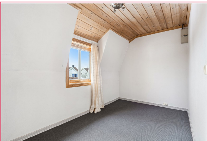
Koselig og praktisk soverom 4 med plass til dobbeltseng og garderobe eller enkeltseng og arb.plass.