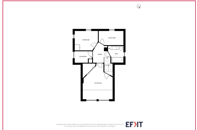
God og praktisk planløsning i 2.etasje.