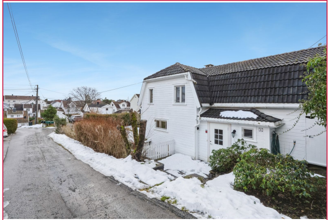
Koselig adkomst, som blir svært idyllisk på sommeren.