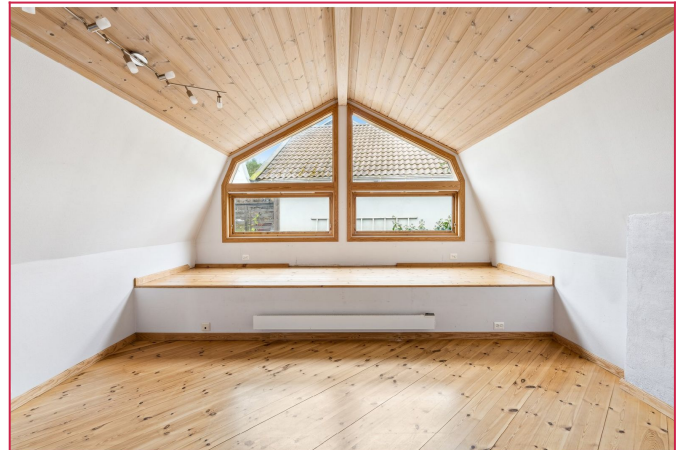
Stort soverom eller loftstue? God plass til dobbeltseng, arbeidsplass og garderobe i tillegg kott.