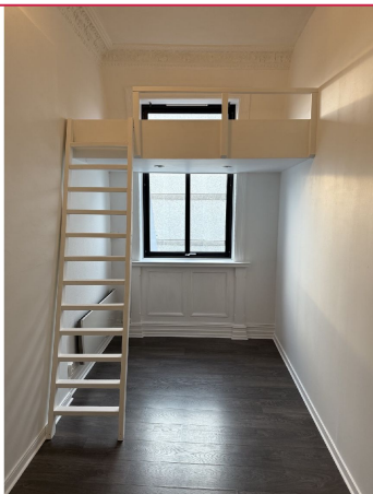
Nymalt hybelrom med soveherms