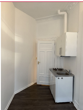
Hybelrom med kjøkkenkrok