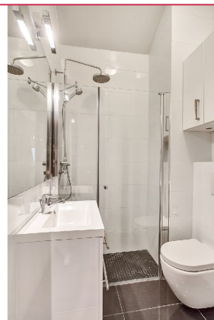
Felles flislagt bad