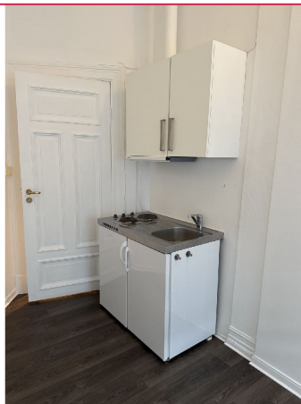
Hybelkomfyr med kjøleskap m/frysedel og kokeplater