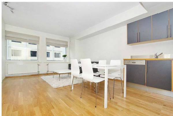
Kjøkken mot stue