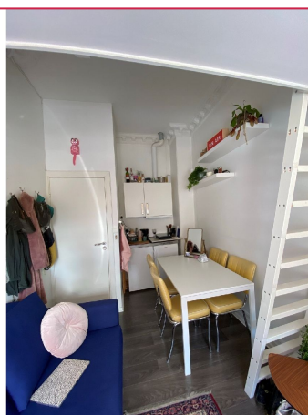
Plass til spisebord - kjøkkenkrok