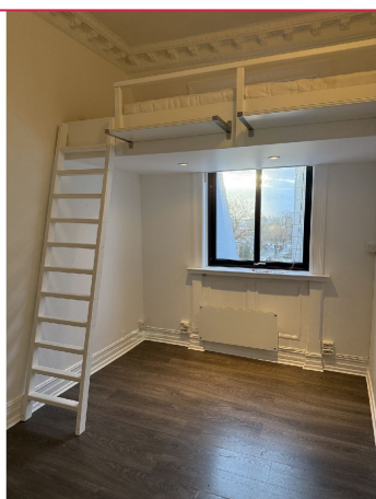
Hybelrom med sovehems