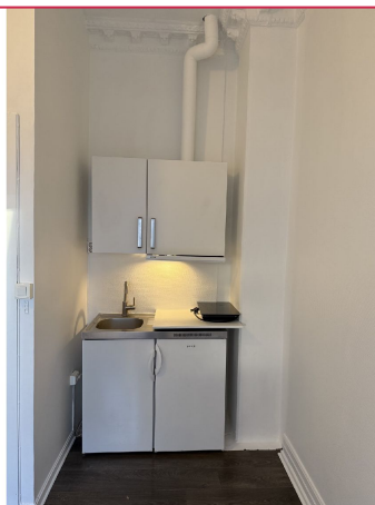
Hybelkjøkkenen med kjøleskap m/frysedel og kokeplater