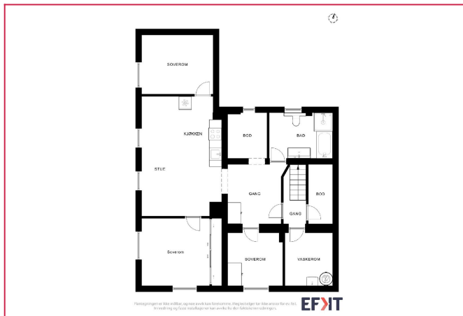
God og praktisk planløsning.