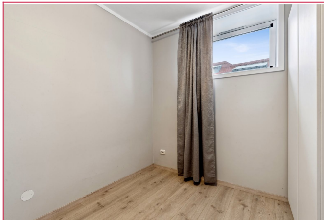
Soverom 3. Praktisk med garderobeskap og laminatgulv.