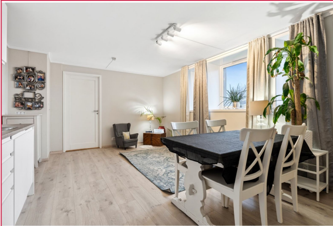
Åpen stue/kjøkken løsning. Godt med plass til spisebord og sittegruppe. Flott utsikt til sjøen.

SAKSNUMMER 56807 - ØSTRE STRANDGATE 66 E, 4608 KRISTIANSAND S