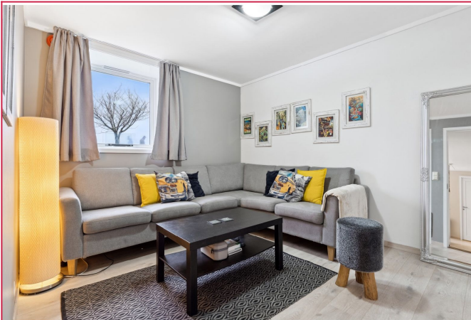
Soverom 1 har sjøutsikt. Plass til dobbeltseng, arbeidspult og garderobe.