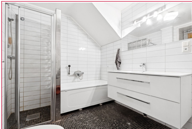
Badet er moderne og har stort spill med god belysning og god oppbevaringsplass i servantskap.