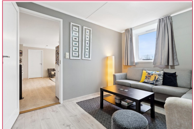
Tilgang til stue/kjøkken fra soverom 1. Lyse farger og pent laminatgulv.