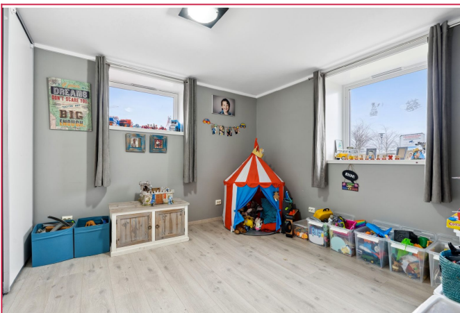
Soverom 2 har sjøutsikt og innebygd skyvedørgarderobe. Plass til dobbeltseng og arbeidspult.