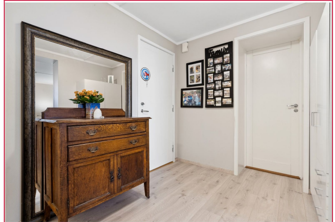
Praktisk og romslig gang med skap for oppbevaring.