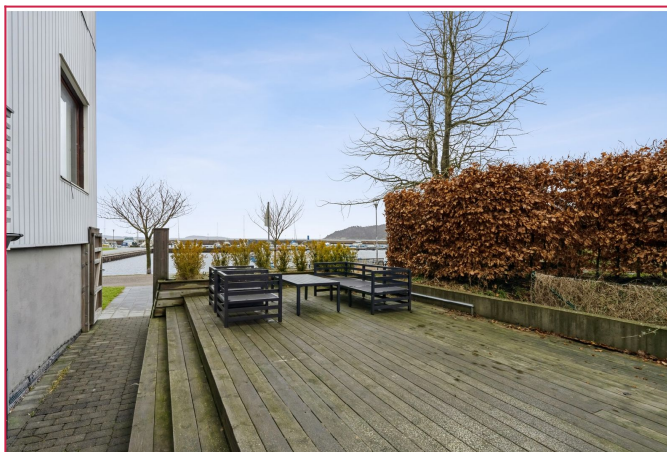
Terrasse til disposisjon. En god plass å nyte varme sommerdager, med utsikt til sjøen.