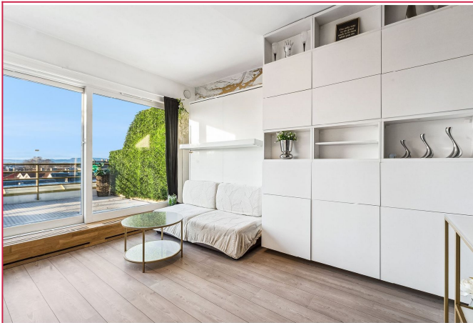
Meget arealeffektiv bolig med god lagringsplass.