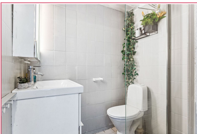
Bad med varmekabler.