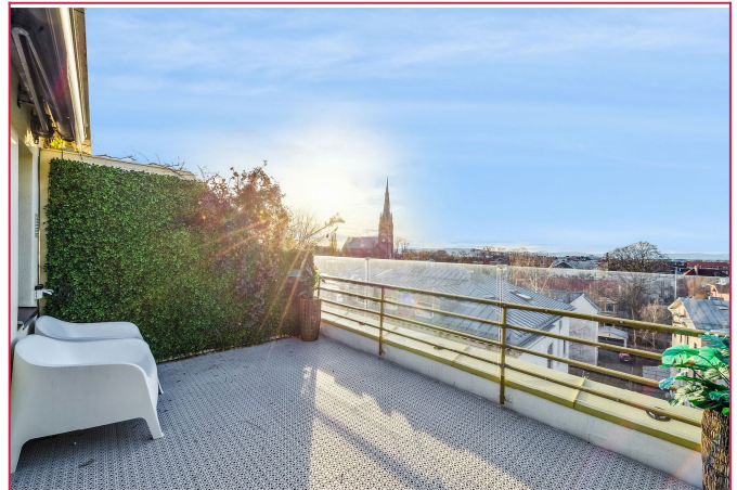
Takterrassen har sol hele dagen.