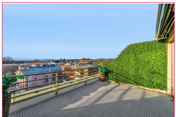
Terrassen er på hele 15m2 og med fantastisk utsikt over byen.