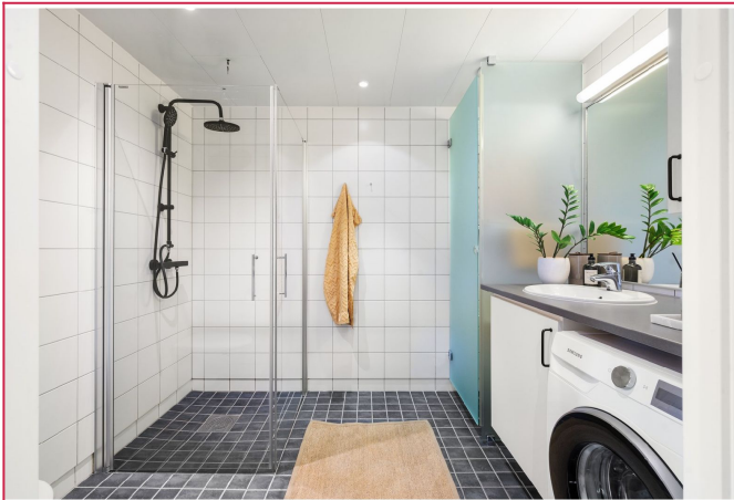
Stort bad m/ gode lagringsmuligheter