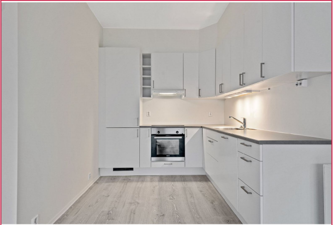
Pent kjøkken med integrerte hvitevarer - godt med skap- og benkeplass