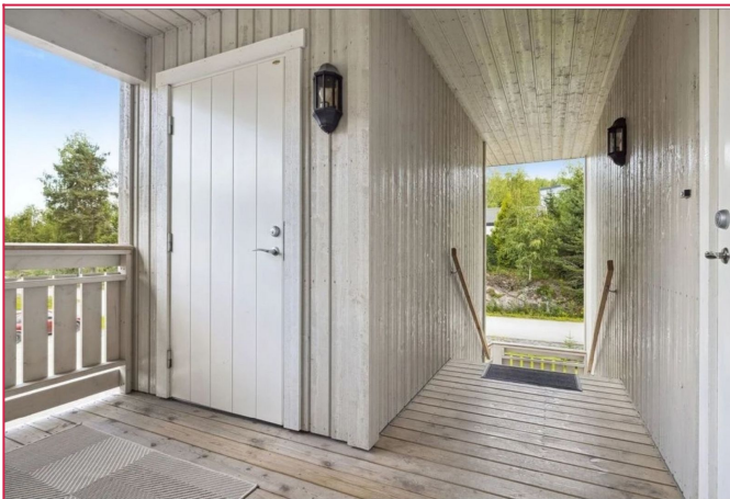
Egen oppgang med overbygd inngangsparti og romslig utebod.