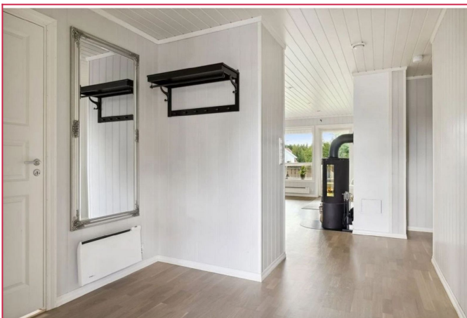
Fin entré med plass til oppbevaring av uteklær og sko.