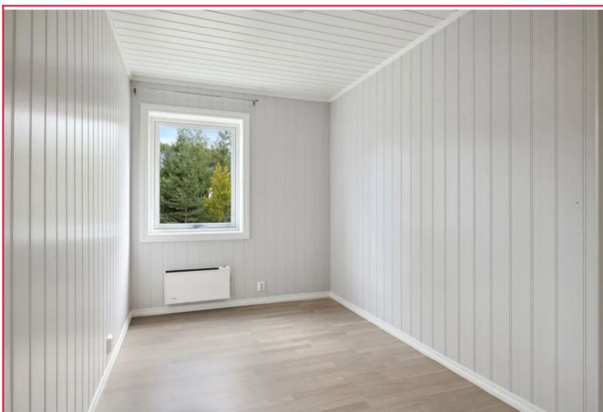
Soverom 3 er likt soverom 2 med plass til seng, skrivebord og garderobe.