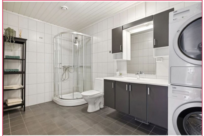
Flislagt bad med innholdsrik servant, WC, kabinett, vaskemaskin og tørketrommel.