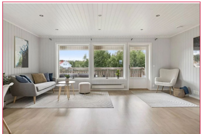
Leiligheten har balansert ventilasjon og solceller på taket.