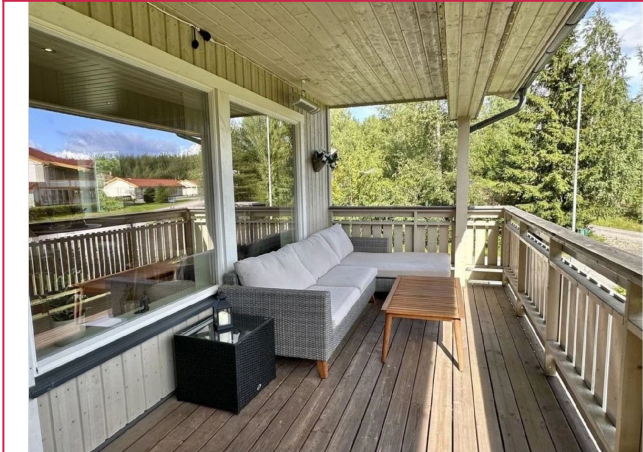
Veranda ut fra stuen er også overbygd og har terrassevarmer.