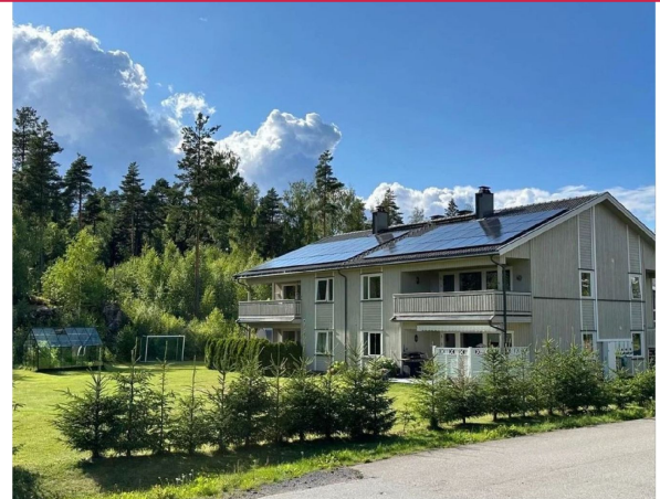
Leiligheten er i 2. etasjen og har solceller på taket som reduserer strømutfiktene.