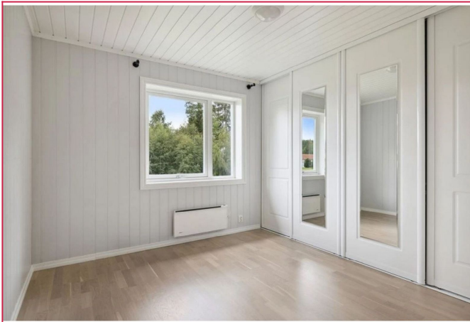
Hovedsoverommet har en romslig skyvedørgarderobe.