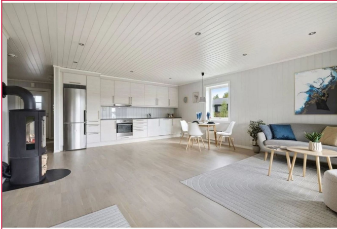
Stor og romslig stue med åpen kjøkkenløsning.