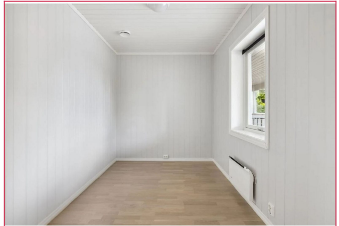
Soverom 2 er av fin størrelse og passer utmerket som barnerom.