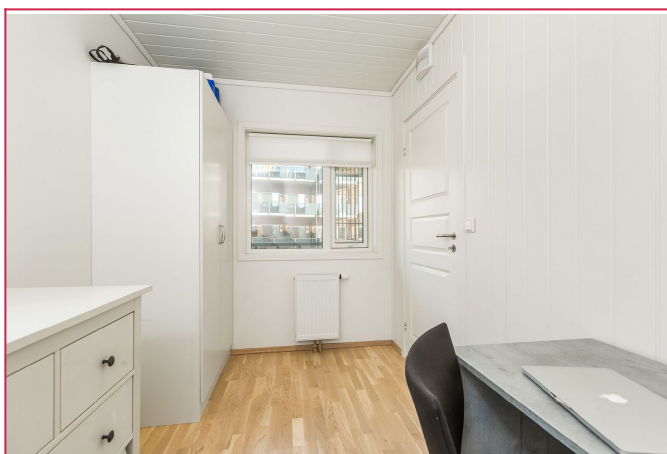
Soverom nr. 3 passer fint som barnerom, gjesterom eller kontor.