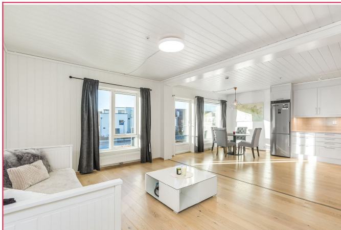
Lys og luftig stue med utgang til balkong.