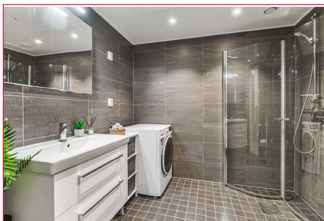
Delikat flislagt baderom med opplegg for vaskemaskin.