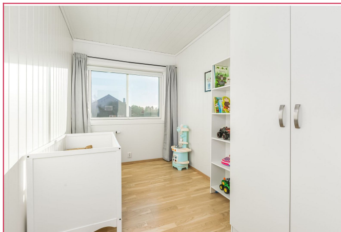
Soverom nr. 2 er også av god størrelse med garderobeskap.