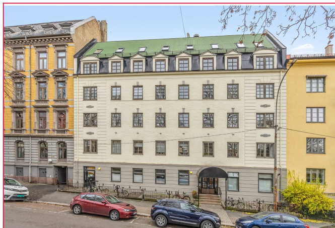
Fasade Frederik Stangs Gate 33