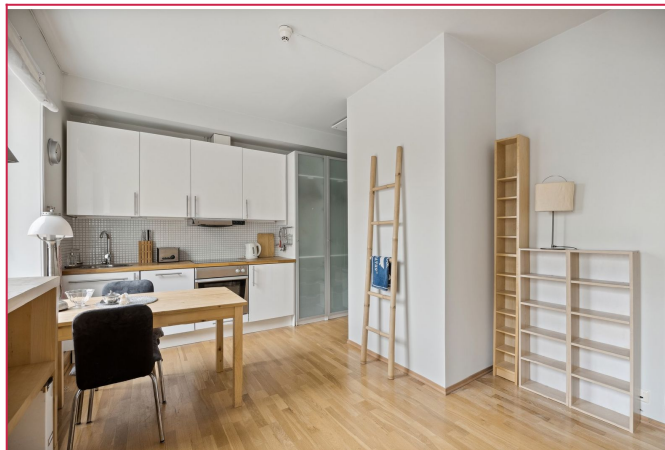
Romslig 1-roms leilighet med rikelig av lagringsplass