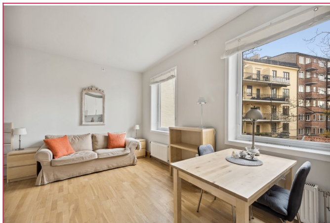
Boligen leies ut møblert.