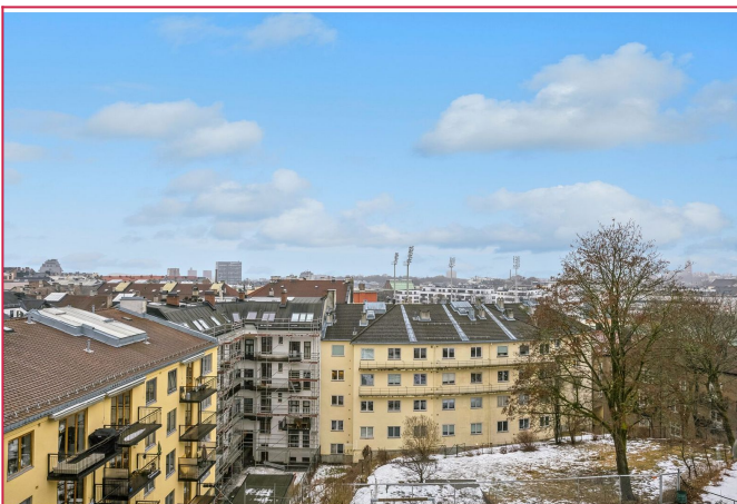
Utsikt fra balkong, stue og spisestue.