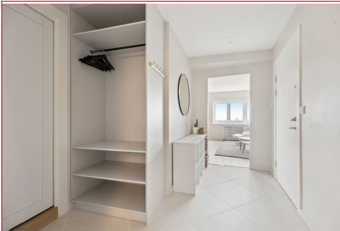
Entré med fine fliser og garderobeskap.