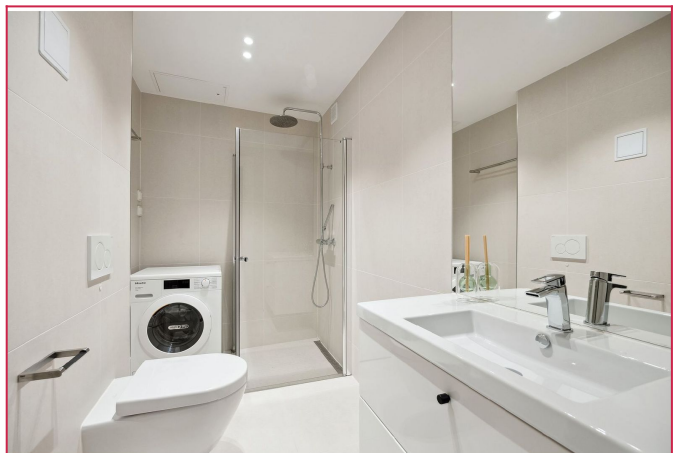
Lekker bad med varme i gulv. Vaskemaskin følger.