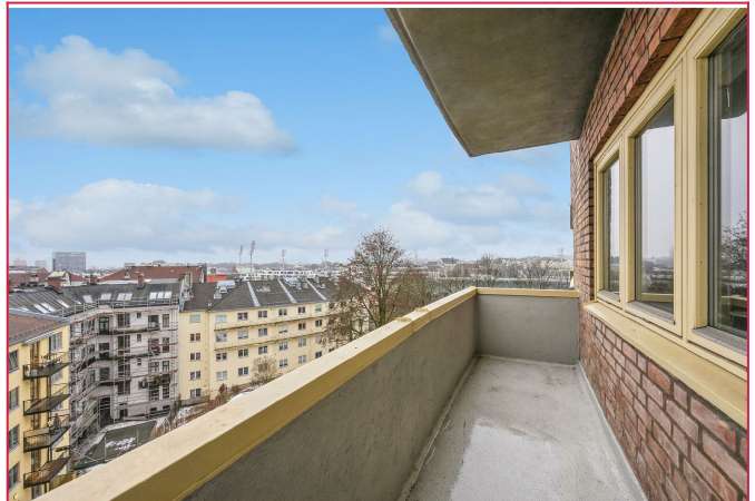
Balkong med utsikt