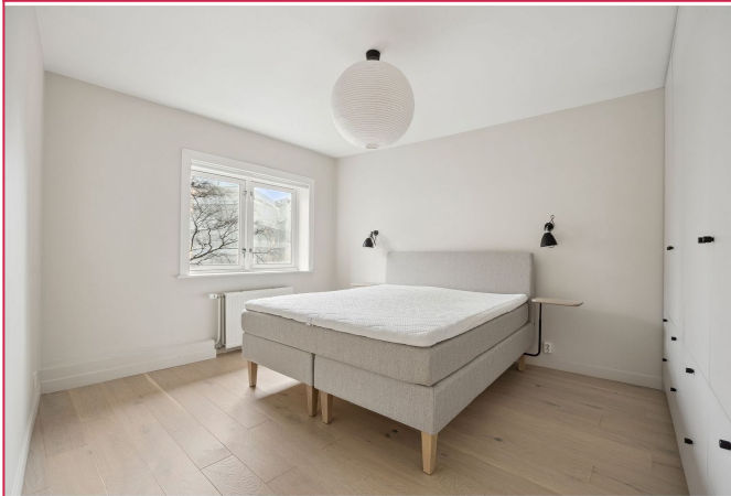
Hvovedsoverom med dobbeltseng og godt med skaplass.