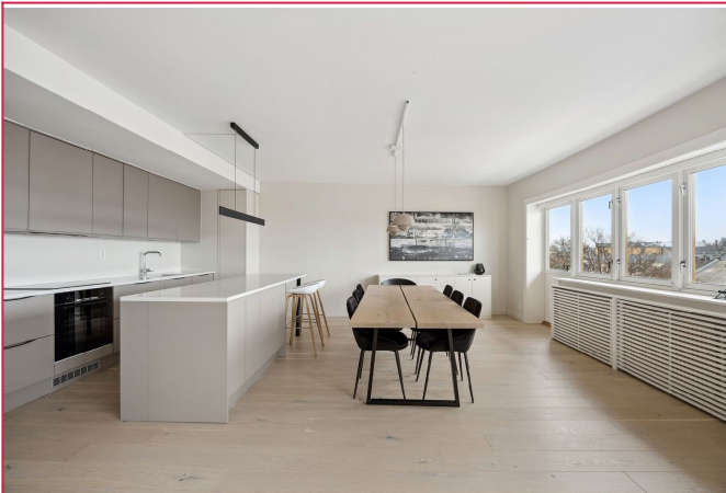
Kjøkken med kjøkkenøy og spisestue. Utgang til balkong.