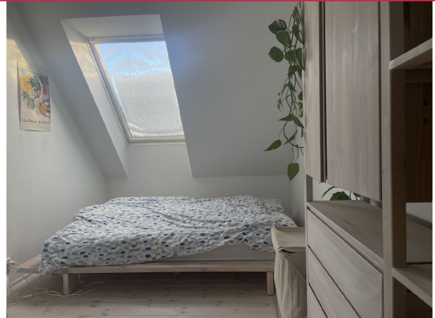
Soverom med plass til stor seng og garderober.