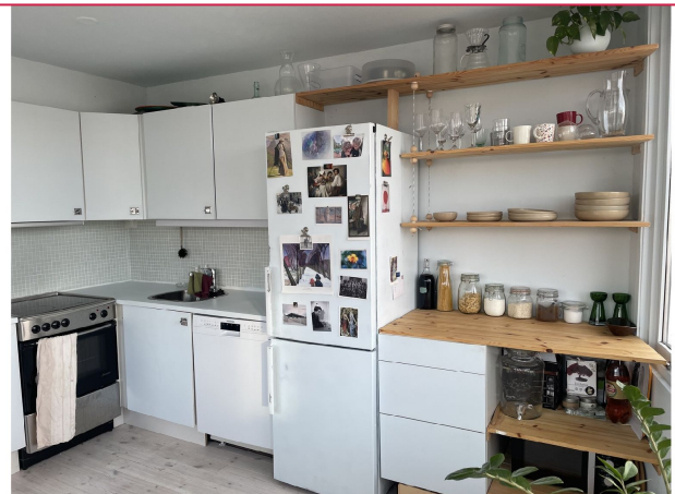
Åpen løsning mot kjøkken. Kjøkkenet er fra 2019 og levert av HTH. Hvitevarer medfølger.