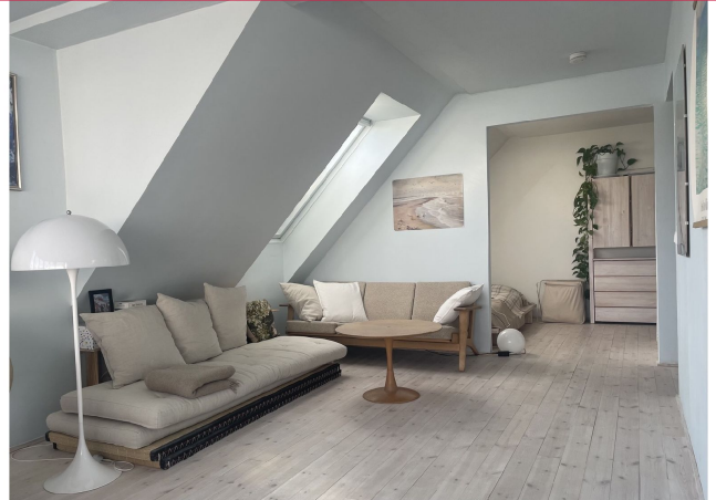
Stuen har god plass til sofagruppe.