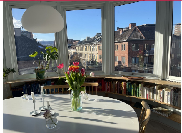
Spisegruppe med utsikt.