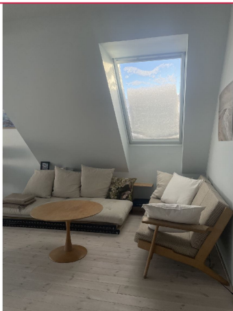
Leiligheten får mye lys gjennom store vinduer.