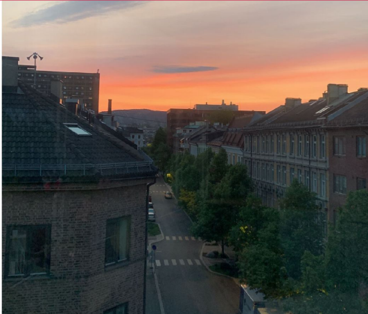
Nydelig utsikt fra vindusrekken.