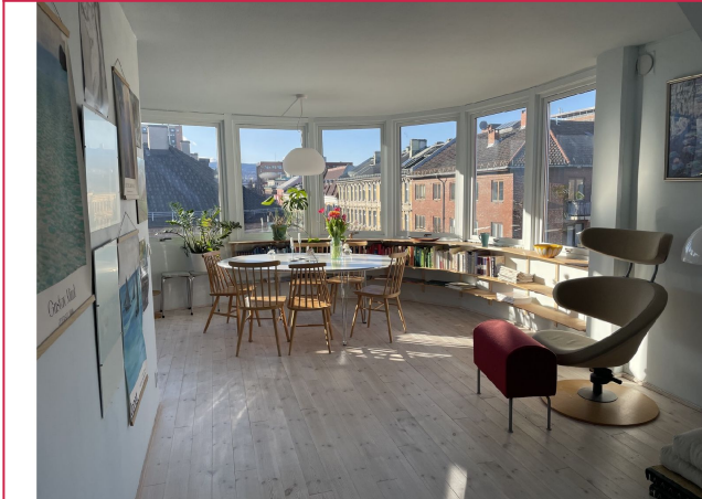
Leiligheten har en stor stue med rom for flere sittegrupper.