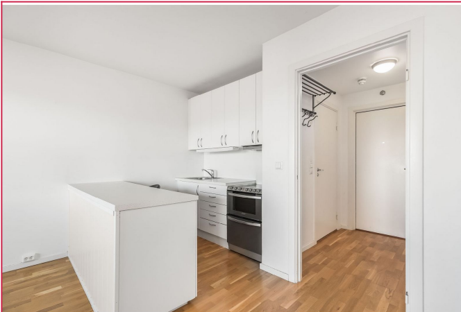
Kjøkken med oppvaskmaskin, kombiskap og komfyr. Bar løsning som fungerer som spisebord.