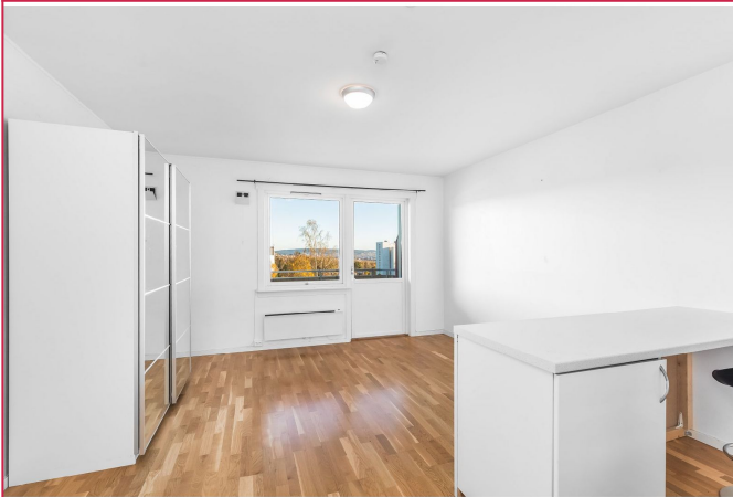
Lyst oppholdsrom med god plass til seng og tilhørende møblement. Garderobeskap kan flyttes på