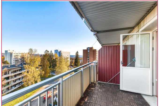
Balkong på ca 8 kvm med formiddagssol.