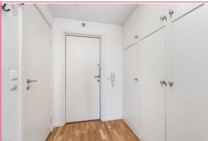
Entre med integrert skap som gir rikelig med oppbevaringsmuligheter.