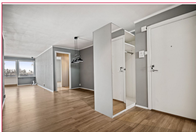
Entré med garderobeløsning