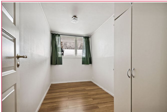
Soverom nr. 2