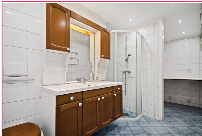
Baderom med dusjhjørne