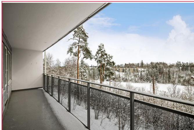
Balkong med utgang fra stuen