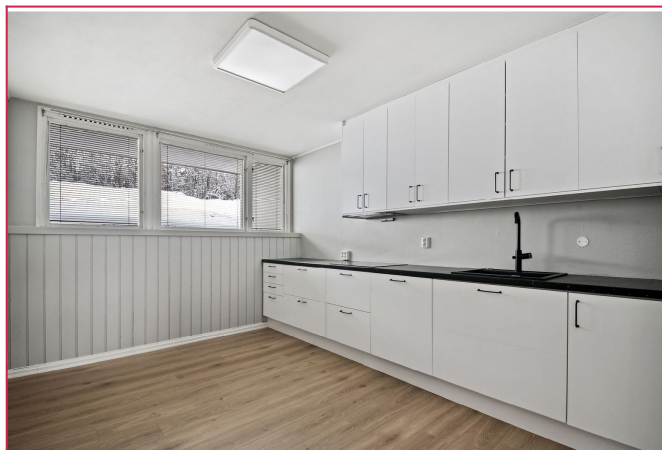
Kjøkken med god skap- og benk plass