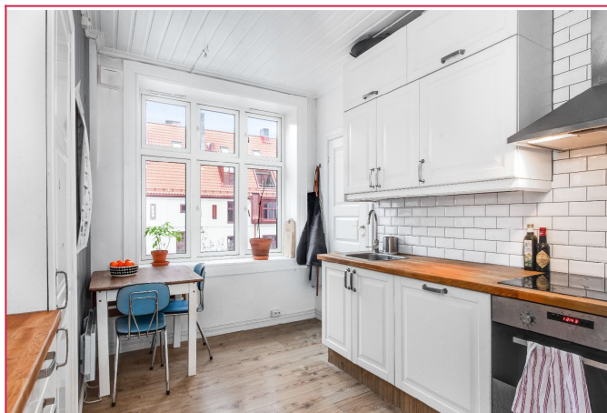
Kjøkken med god skap og benkeplass