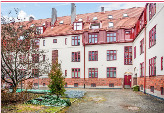
Inngang fra rolig bakgård