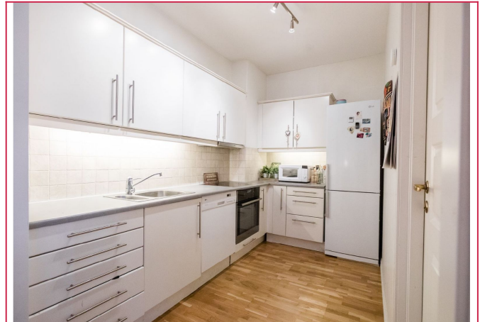
Separat kjøkken med medfølgende hvitevarer.