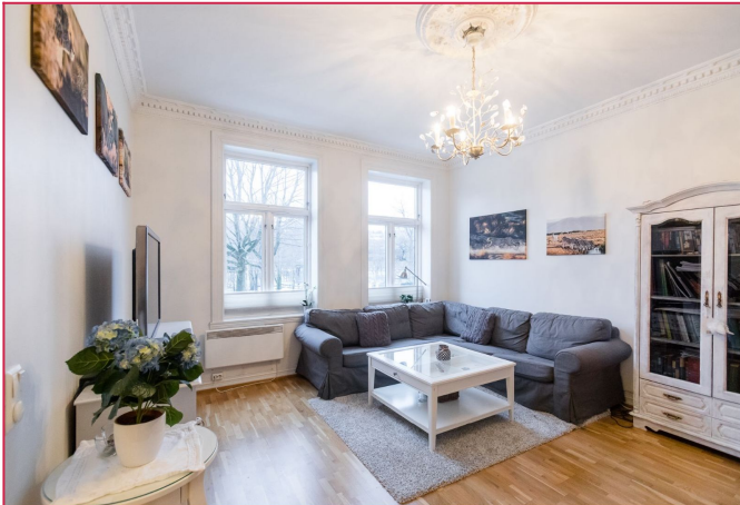
Romslig stue med store vindusflater og klassiske detaljer.