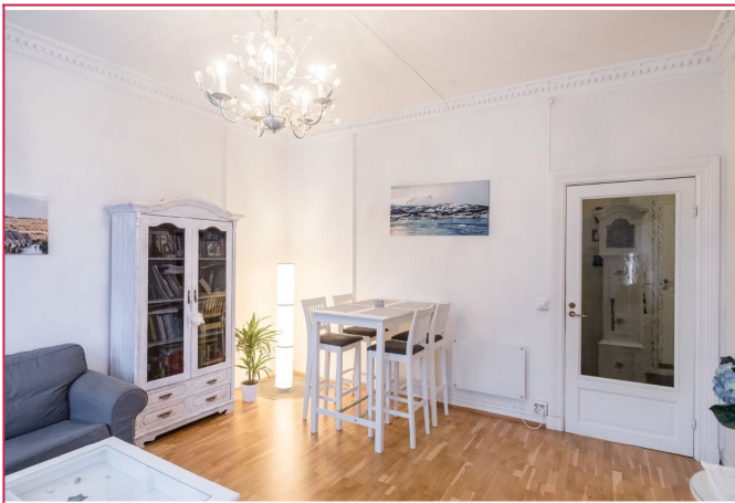
Stue med plass til spisebord.