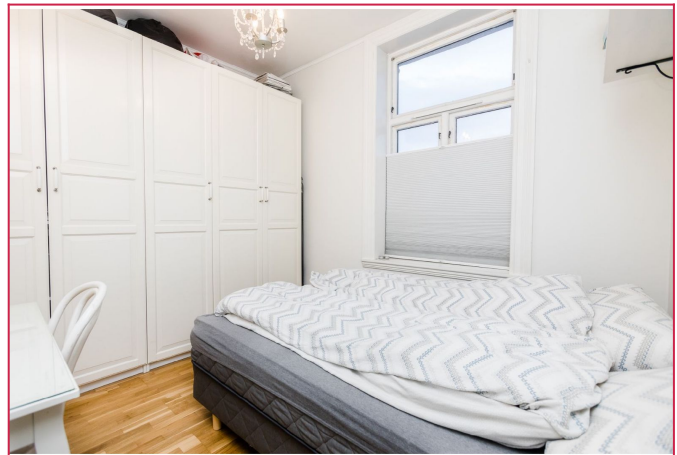
Soverom 1 med plass til garderobeskap og dobbeltseng.