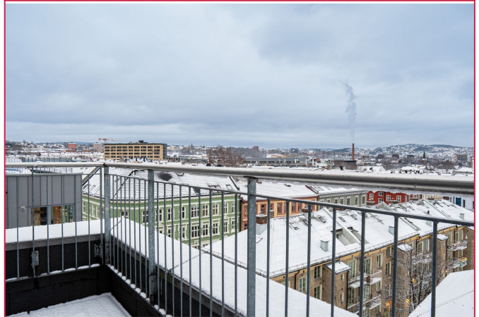
Koselig balkong med fin utsikt