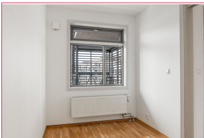
Soverom med plass til dobbeltseng