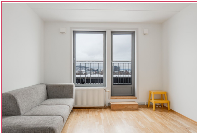
Oppvarming, varmtvann og kabel-tv er inkludert