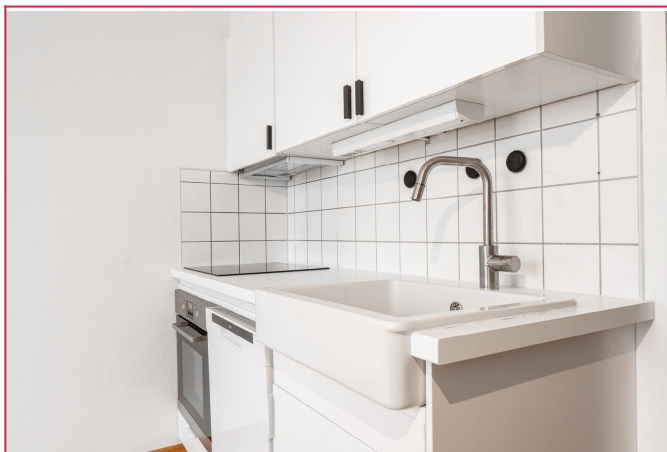
Praktisk kjøkken med integrert koketopp og komfyr, samt frittstående kjøleskap