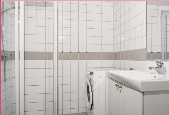
Flislagt bad med varmekabler i gulvet og plass til vaskemaskin