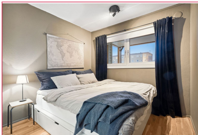
Leiligheten rommer to soverom av god størrelse - dette er på 10,4 kvm.