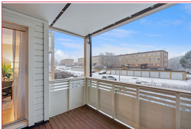
Fra stuen har du utgang til en vestvendt balkong. God plass til ønsket utemøblement.