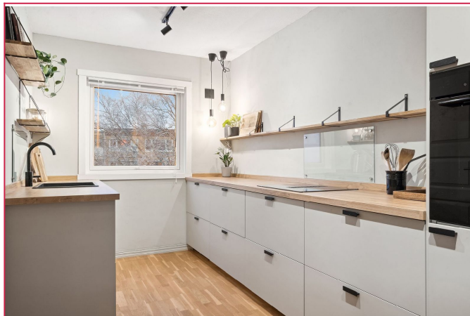
Pent og gjennomført kjøkken med mye skap- og benkeplass.