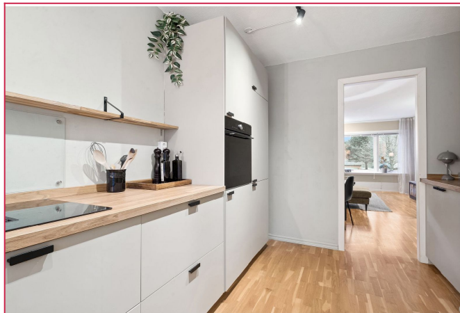
Kjøkkenet er utstyrt med integrerte hvitevarer som platetopp, stekeovn, oppvaskmaskin og kombiskap.