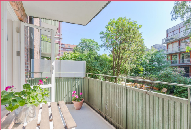
Romslig balkong vender mot bakhagen - Balkongen ble pusset opp i 2022. Dette bildet er eldre