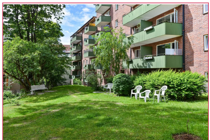
Felles hage - bygget holder på med balkongrehabilitering