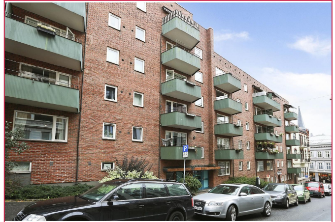
Fasade - Bygget har attraktiv beliggenhet like ved Bogstadveien