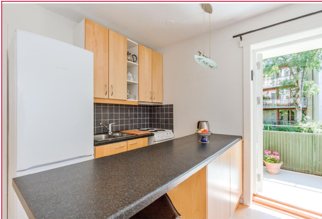
Kjøkken med barstoler og litt spiseplass