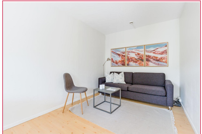
Sofakrok i stue. Denne sofaen er skiftet ut til en nyere sofa nå