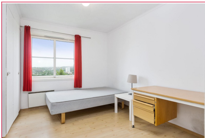
Bilder er fra 2 etasje, men leiligheten har identisk planløsning!