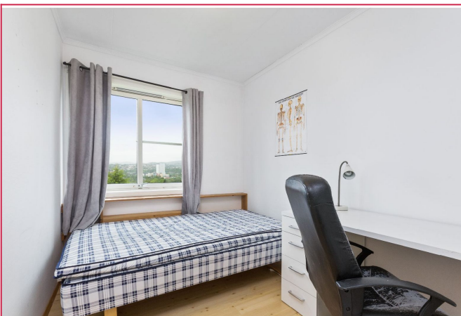
Bilder er fra 2 etasje, men leiligheten har identisk planløsning!