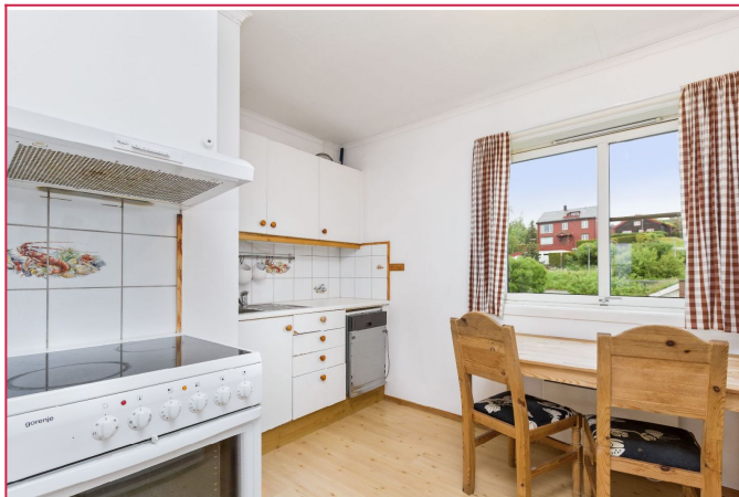
Bilder er fra 2 etasje, men leiligheten har identisk planløsning!