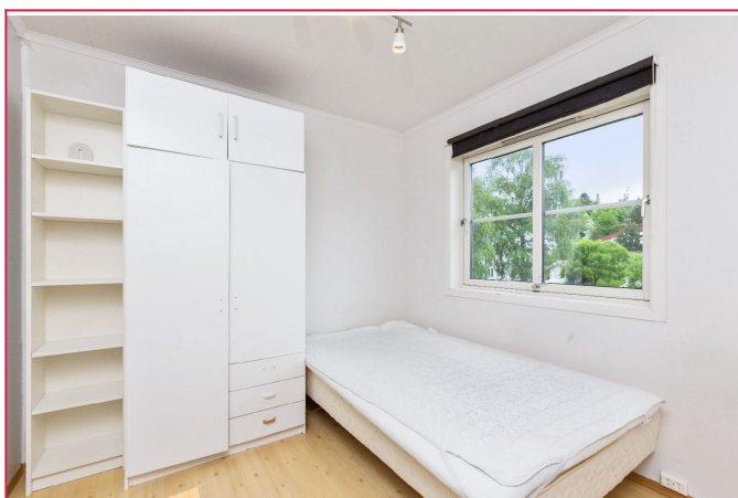
Bilder er fra 2 etasje, men leiligheten har identisk planløsning!