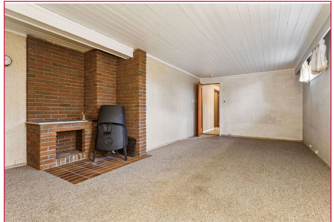
Stue med varmekabler i kjelleren.