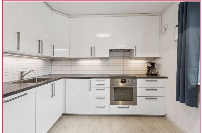
Kjøkkenen med nødvendige hvitevarer