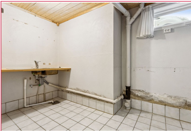
Vaskerom i kjelleren