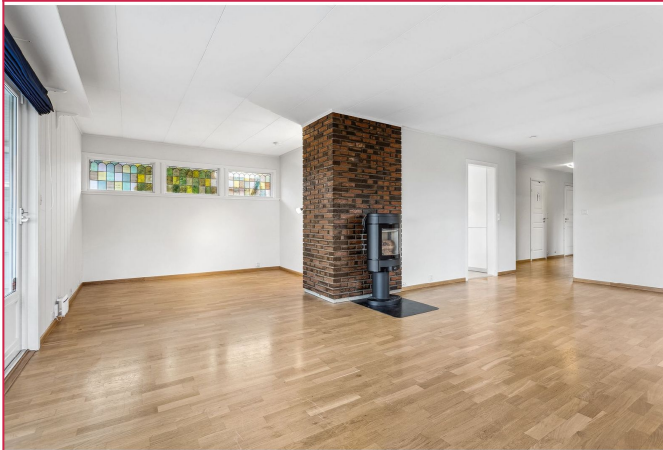
Stuen har både peis og varmepumpe